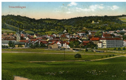
Postkarte mit einer Gesamtansicht von Treuchtlingen und der Synagoge, 1920er-Jahre.

Diese Synagoge wurde im Novemberpogrom 1938 über das Gemeindehaus gestürmt und von SA-Leuten in Brand gesetzt. Die Feuerwehr beschränkte sich auf den Schutz der umliegenden christlichen Häuser. Am 9. Dezember 1938 gingen das Synagogengrundstück und das Schulhaus (Uhlengasse 5 und 7) in den Besitz der Stadt über, die Ruinen wurden abgetragen. Alle Reparaturkosten an umstehenden Häusern musste die jüdische Gemeinde übernehmen. Das Synagogengrundstück wird heute als Lagerfläche einer Schreinerei genutzt.