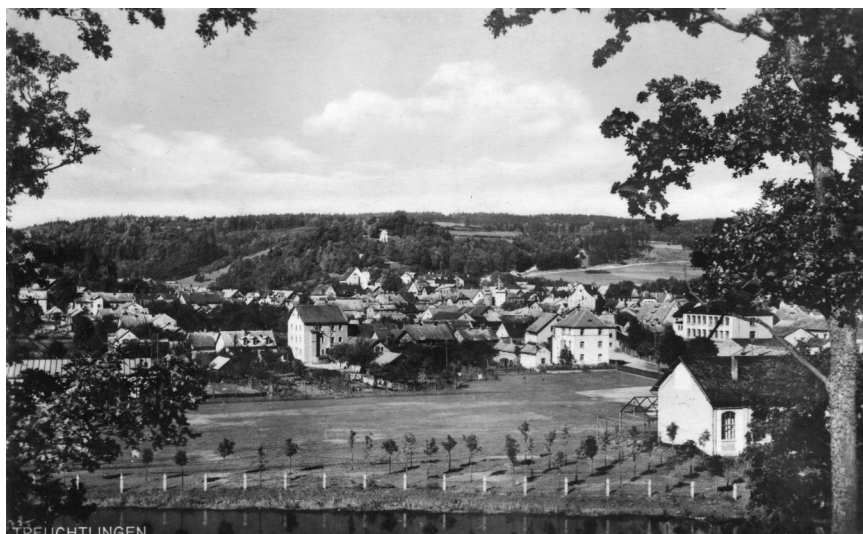
Postkarte mit einer Gesamtansicht von Treuchtlingen und der Synagoge, 1920er-Jahre.

Erstmals werden Treuchtlinger Juden im Martyrologium des Nürnberger Memorbuchs als Opfer der Pestpogrome 1348 bis 1353 erwähnt. Ab 1447 unterstand der Markt, und damit auch die dort lebenden Schutzjuden dem Adelsgeschlecht Pappenheim. 1596 werden neun jüdische Familienväter als Hausbesitzer aktenkundig. 1647 fiel Treuchtlingen an die Markgrafen von Brandenburg-Ansbach. Diese förderten eine weitere Ansiedelung von Schutzjuden, um die Verheerungen des Dreißigjährigen Krieges auszugleichen. Im Jahr 1665 konnte die Treuchtlinger Gemeinde mit zehn Hausvätern das erste Mal einen Minjan bilden. Jüdische Häuser lagen vor allem an der Hauptstraße, im 19. Jahrhundert wohnten weitere Familien auch nahe der Synagoge in der heutigen Uhlengasse, Kirchstraße und Marktgasse.