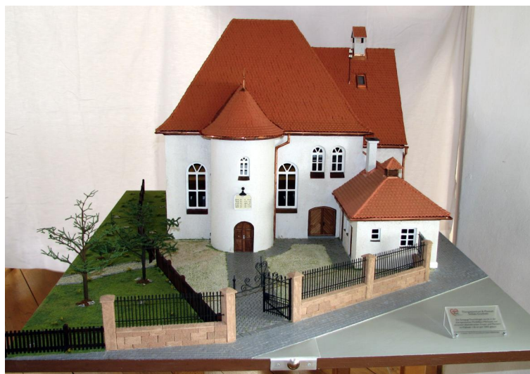
Modell der Synagoge Treuchtlingen im Maßstab 1:25, angefertigt 2006.

Über eine mittelalterliche Synagoge ist nichts bekannt; die Vermutung liegt nahe, dass die höheren Gottesdienste in der Pappenheimer Synagoge gefeiert wurden, während normale Andachten in Privathäusern stattfanden.