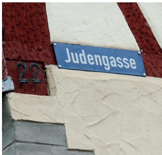
Ellingen, Straßenschild der Judengasse (Aufnahme 2022).

Ellwangen war seit dem 14. Jahrhundert Sitz des Landkomturs des Deutschen Ordens für die Ballei (Ordensprovinz) Franken. Die Deutschritter besaßen das Privileg, in ihren Besitztümern Schutzjuden aufzunehmen. Ellingen blieb bis 1814 der Sitz eines wichtigen Bezirksrabbinats, insbesondere für die Gemeinden in der fränkischen Ballei des Deutschen Ordens. Vermutlich hatten sich erste Familien nach ihrer Vertreibung aus Nürnberg 1499 oder Weißenburg 1519 in Ellingen niedergelassen. Im Jahr 1542 befahl Hochmeister Walther von Cronberg (reg. 1527-1543), frisch gedruckte Exemplare seines zwei Jahre zuvor erlassenen Mandats wider den Wucher zu verteilen. Landkomtur Johann Wilhelm von Zocha auf Wald (reg. 1682-1690) erließ am 18. März 1685 eine "Policey-Ordnung", die Juden den christlichen Mitbürgern rechtlich beinahe gleichstellte.