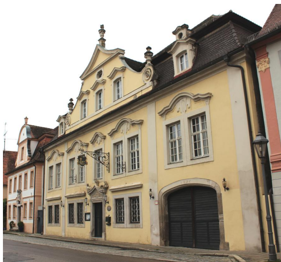
Ellingen, Weißenburger Straße 17, Palais Samuel Landauer mit ehem. Betsaal der jüdischen Gemeinde (Aufnahme 2022).