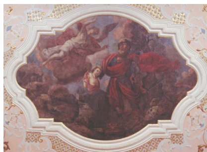
Ellingen, Gasthaus Römischer Kaiser - Palais Landauer, Detail des Stucks mit dem Traum Jakobs von der Himmelsleiter (Aufnahme 2013).

(Gebetsrichtung nach Osten) angab.