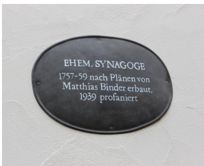
Ellingen, Neue Gasse 14, ehemalige Synagoge in Ellingen mit Spuren einer Mesusa und Gedenktafel (Aufnahme 2022).