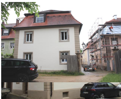
Der Festsaal im Gebäude Weißenburger Straße 17 wurde in der ersten Hälfte des 18. Jahrhunderts als Synagoge genutzt (Aufnahme 2014).