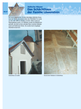
Wandtafeln der 2015 eingerichteten Ausstellung "Juden in Ellingen 1540-1938" des Ellinger Stadtarchivs.