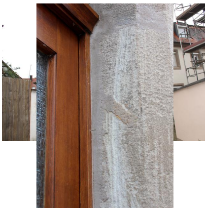
Ellingen, Neue Gasse 14, ehemalige Synagoge in Ellingen mit Spuren einer Mesusa und Gedenktafel (Aufnahme 2022).