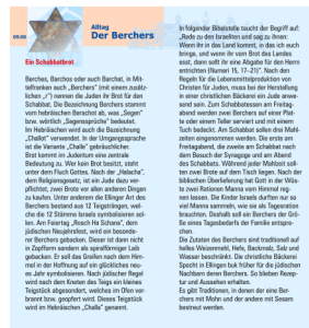
Wandtafeln der 2015 eingerichteten Ausstellung "Juden in Ellingen 1540-1938" des Ellinger Stadtarchivs.