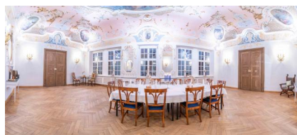
Ellingen, Gasthaus Römischer Kaiser - Palais Landauer, Blick nach Norden im barocken Fest- und ehem. jüdischen Betsaal (Aufnahme 2022).

Ellingen, Gasthaus Römischer Kaiser - Palais Landauer, Gesamtansicht mit Blick nach Osten im Fest- und ehem. jüdischen Betsaal (Aufnahme 2022). In dieser Perspektive wird klar, dass das zentrale Mittelfenster durch seinen kronenförmigen Stuckaufsatz den Misrach