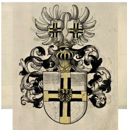
Das sog. "Scharfe Mandat" des Deutschen Ordens für alle seine Kommenden, 1540. StAL, B287 Bü 4.