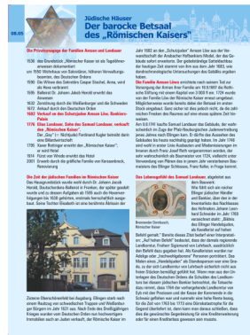
Wandtafeln der 2015 eingerichteten Ausstellung "Juden in Ellingen 1540-1938" des Ellinger Stadtarchivs.