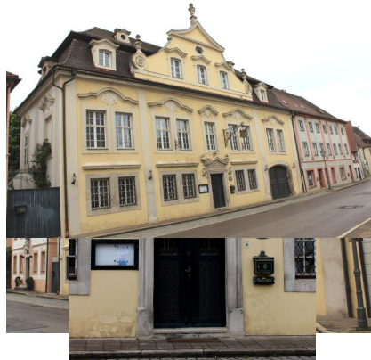
Ellingen, Weißenburger Straße 17, Palais Samuel Landauer mit ehem. Betsaal der jüdischen Gemeinde (Aufnahme 2022).