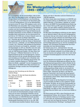
Wandtafel der 2015 eingerichteten Ausstellung "Juden in Ellingen 1540-1938" des Ellinger Stadtarchivs.