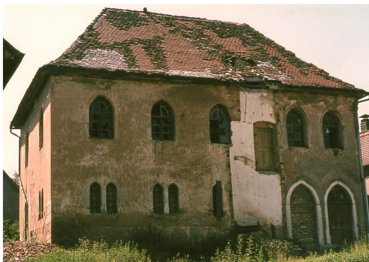
Das Bild zeigt die Synagoge vor 1972. Das Synagogengebäude wurde im Zweiten Weltkrieg als Getreidespeicher, später als Turnhalle (noch in den 1960er-Jahren) zweckentfremdet. 1972 erfolgte der Abbruch. Danach wurde auf dem Grundstück ein Wohnhaus erstellt.