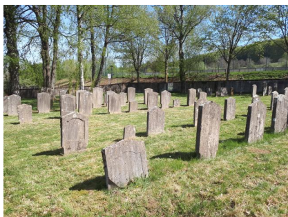
Jüdischer Fridhof Thalmässing, Aufnahme 2018.

In der epigrafischen Datenbank des Steinheim-Instituts sind 132 Grabinschriften von 1832 bis 1935 hier online erfasst.