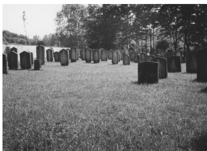
Jüdischer Friedhof Thalmässing.