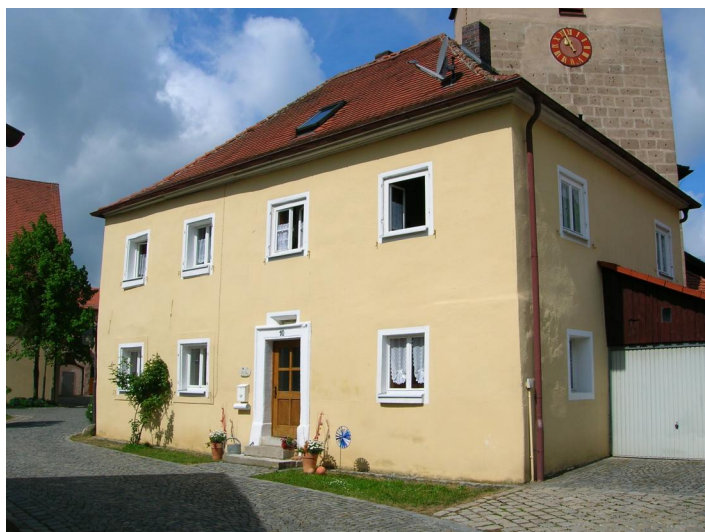
Das Schulhaus (Schulgasse 10) der jüdischen Gemeinde wurde 1840 eingerichtet. Das Gebäude stammt aus dem 18. Jahrhundert.

Im frühen 15. Jahrhundert lebten jüdische Familien im Dorf Eysölden, fünf Kilometer nördlich von Thalmässing. Aber erst 1480 ist auch dort ein Schutzjude des Markgrafen Albrecht Achilles von Brandenburg-Ansbach (reg. 1440-1486) nachgewiesen. Eine Gemeinde im eigentlichen Sinne konnte sich jedoch noch nicht entwickeln, vereinzelte und sporadische Niederlassungen wechselten sich mit Ausweisungsanordnungen der Hohenzoller Landesherren ab. Von 1542 bis 1600 gab es im Ort überhaupt keine jüdischen Bewohner. Ein erneutes Edikt zur Vertreibung der Juden war 1609 wohl nicht erfolgreich, denn ein Jahr später lebten jüdische Familien in Thalmässing und konnten für die nächsten 330 Jahre ein relativ ruhiges und gesichertes Dasein führen.