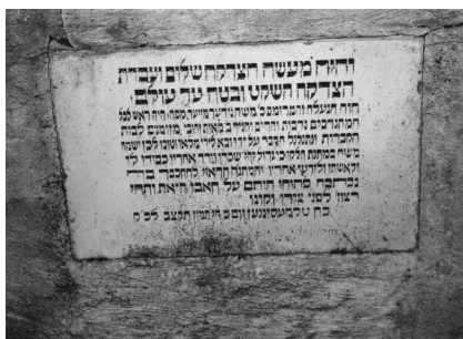
Jüdischer Fridhof Thalmässing, Aufnahme 2018.