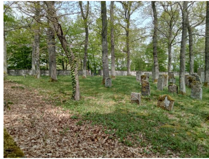
Jüdischer Friedhof Uehlfeld, 2022.