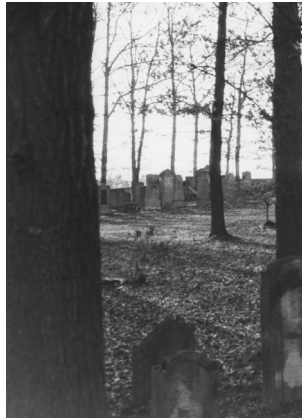
Jüdischer Friedhof Uehlfeld.