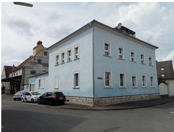
Kirchenstrasse 6 mit dem Gebäude der jüdischen Schule. Links der Schule ist das Gebäude der ehemaligen Synagoge (Raiffeisenstraße 7 zu erkennen, Aufnahme 2022.

Im Jahr 1607 sind erstmals Juden in Uehlfeld gesichert nachweisbar, als sich der evangelische Ortspfarrer Sebastian Rüdinger beim markgräflichen Kastner über eine geplante israelitische Hochzeitsfeier im Ort beschwerte. Demnach hatten sich bereits früher einige israelitische Familien angesiedelt und ihren Glauben praktizierten. Während des 30-jährigen Krieges (1618-1648) herrschte in Uehlfeld große Not und Elend. Die Menschen mussten miterleben, wie kaiserlich-habsburgische Kroaten am 8. Juli 1632 den Ort plünderten und niederbrannten. Zu diesem Zeitpunkt lebten 39 jüdische Männer, Frauen und Kinder in Uehlfeld, die sich auf die Familien „Amschel Jud, Wolff Jud, Mosch Jud, David Jud, Joseph Jud, Marx Jud und Mayer Jud“ verteilten. Nach der Brandschatzung war nur noch Mayer am Leben.