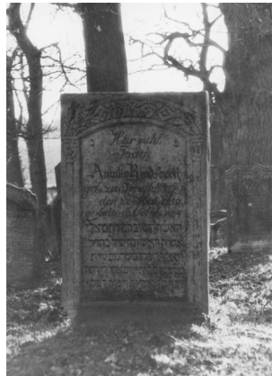
Jüdischer Friedhof Uehlfeld.