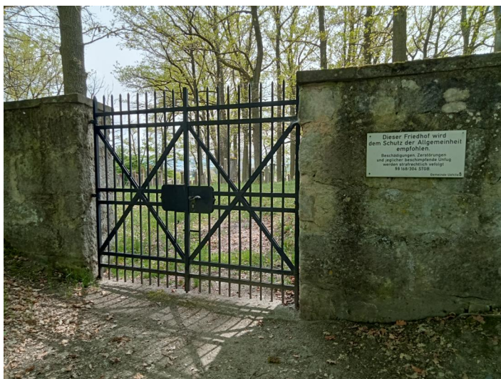
Jüdischer Friedhof Uehlfeld, 2022.

Der jüdische Friedhof liegt auf einem Hügel ca. einen Kilometer nordwestlich von Uehlfeld. Er hat eine Größe von über 4000 qm und wurde 1734 eingerichtet. Die letzte Beisetzung war 1937.