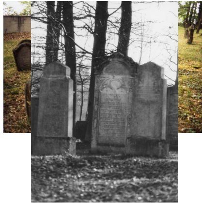
Jüdischer Friedhof von Uehlfeld.