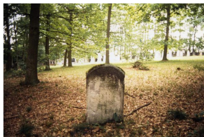
Jüdischer Friedhof von Uehlfeld.