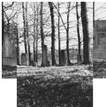
Jüdischer Friedhof Uehlfeld.