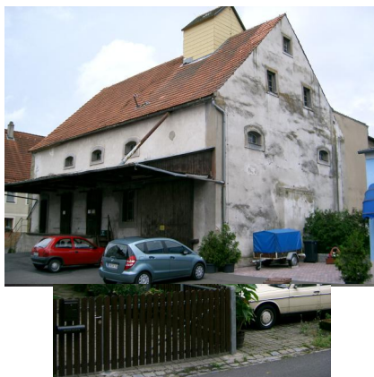
Kirchenstrasse 6 mit dem Gebäude der jüdischen Schule. Links der Schule ist das Gebäude der ehemaligen Synagoge (Raiffeisenstraße 7 zu erkennen, Aufnahme 2022).