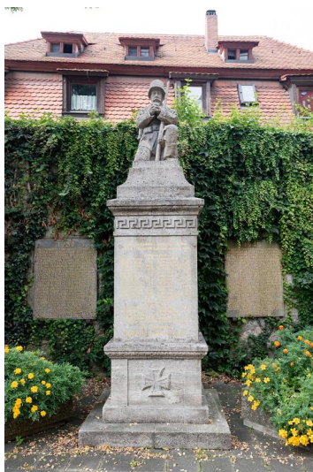
Uehlfeld, Kriegerdenkmal für die Gefallenen beider Weltkriege vor St. Jakobus (Aufnahme 2017).

In Uehlfeld befindet sich das Kriegerdenkmal für die Gefallenen beider Weltkriege vor der evang.-luth. Kirche St. Jakobus in der Ortsmitte. Auf dem mittleren Denkmal mit der Skulptur eines betenden Soldaten, das den Kriegstoten von 1914–1918 gewidmet ist, kann man unter der Widmung: Zum Gedächtnis unserer Söhne welche im Weltkrieg 1914/18 gekämpft und geblutet haben. Gefallen sind: / Die Gemeinden Uehlfeld u. Weickersdorf auch die Namen folgender jüdischer Gefallener finden: