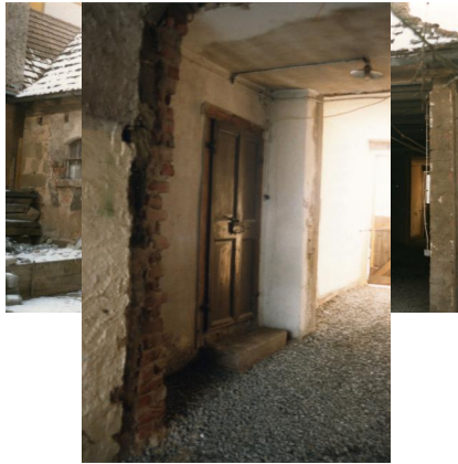
Ehemalige Synagoge Ullstadt.