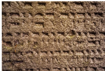
Jüdischer Friedhof von Ullstadt.