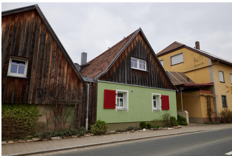
Ullstadt, Buchstraße 10, ehemalige Synagoge und Rabbinerhaus, eingeschossige Bauanlage, 1821/22 (Aufnahme 2021).

Im Jahr 1743 besuchten Gläubige aus Sugenheim einen privaten Betraum in Ullstadt. Auch im frühen 19. Jahrhundert gab es nur ein Andachtszimmer im Haus von Hirsch Sternschein – dem Kunsthistoriker Theodor Harburger zufolge existierten damals sogar zwei Beträume, einer im Dachboden des Hauses Nr. 41 (heute Galgenstraße 6) und einer im Haus Nr. 10a (Lange Straße 12). 1822 wurde eine Synagoge eingeweiht, die als Anbau an das bestehende jüdische Schulhaus (heute Buchstraße 10) den schadhafte rückwärtigen Giebel stabilisierte.