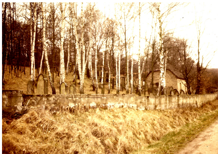
Jüdischer Friedhof Ullstadt; Tahara-Haus, 1980.

Lage: Waldhang südöstlich des Ortes in Richtung Langenfeld.