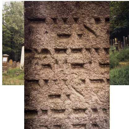
Jüdischer Friedhof von Ullstadt.