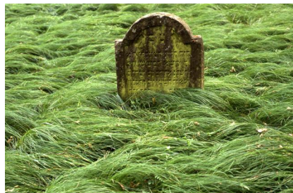
Jüdischer Friedhof von Ullstadt.