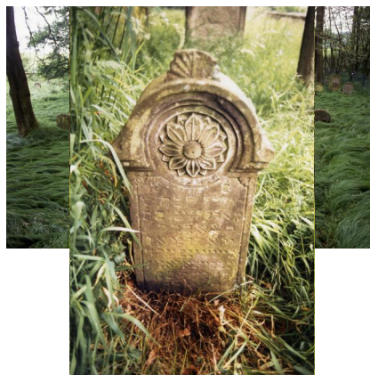
Jüdischer Friedhof von Ullstadt.