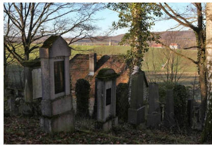
Jüdischer Friedhof Ullstadt, 2009.