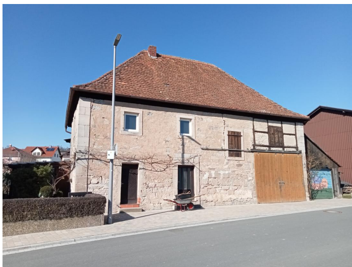
Das Gebäude der ehemaligen Synagoge Schnodsenbach wurde 1899 verkauft und wird als Wohnhaus genutzt (Aufnahme 2022).

Da bereits im 18. Jahrhundert in Schnodsenbach eine jüdische Gemeinde lebte, ist die Existenz eines Betsaal oder eines eigenen Synagogengebäudes wahrscheinlich. Umso mehr, als in den Matrikellisten der 1820er Jahre Samson Michel als Vorsinger und Schächter aufgeführt wird.