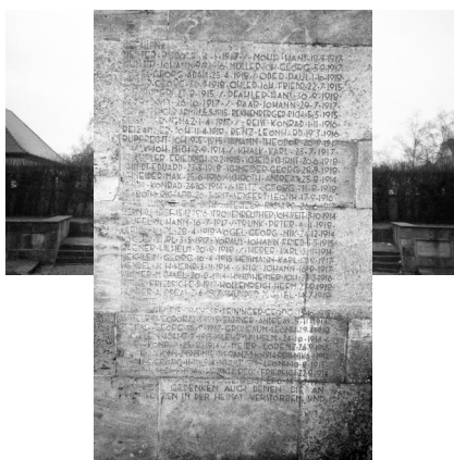
Neustadt an der Aisch, Kriegerdenkmal 1914-18 (Aufnahme Israel Schwierz, 1996). Copyright BayHStA, BS N 80 80/116-18