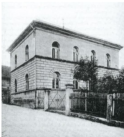
Ansicht der Synagoge Neustadt an der Aisch von 1896. Das Synagogengebäude stand ursprünglich in Pahres und wurde dort 1844 eingeweiht. Nach der Auflösung der Gemeinde wurde das Gebäude 1878 nach Neustadt gebracht und dort 1880 eingeweiht.