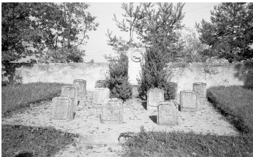
Diespeck, Denkmal für die gefallenen des Ersten Weltkriegs auf dem jüdischen Friedhof (Aufnahme Israel Schwierz, 1996). Copyright BayHStA, BS N 80 80/31-15

Auf dem jüdischen Friedhof von Diespeck östlich des Ortes auf einer Anhöhe befindet sich in einer eigenen, gut gepflegten Anlage das Denkmal für die im Ersten Weltkrieg gefallenen Mitglieder der Gemeinden, die ihre Toten auf diesem Friedhof bestatteten.