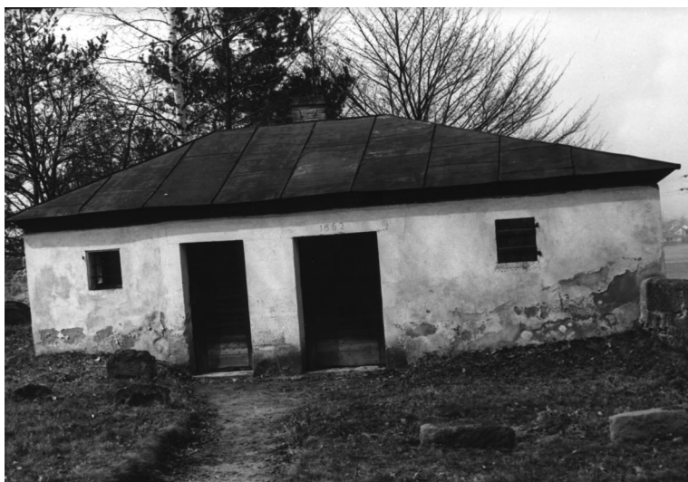
Tahara-Haus des jüdischen Friedhofs Diespeck.

Der jüdische Friedhof liegt östlich des Ortes auf einer Anhöhe unmittelbar an der Kreisstraße nach Dettendorf. Der älteste noch lesbare Grabstein stammt von 1786. Der Friedhof umfasst etwa 2100 qm. Die letzte Beerdigung erfolgte 1938. Das Tahara-Haus mit dem Tahara-Stein ist noch erhalten.