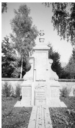
Diespeck, Kommunales Kriegerdenkmal des Ersten

Kriegsgräber auf dem jüdischen Friedhof (Aufnahme Israel Schwier, 1996). Copyright BayHStA, BS N 80 80/31-16