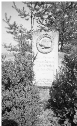
Diespeck, Zentraler Gedenkstein der symbolischen

Rechts und links sowie vor dem Gedenkstein sind elf symbolische Grabsteine angeordnet, auf denen die heute fast vollständig unlesbaren Namen der Gefallenen verewigt waren.