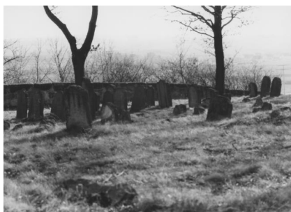
Diespeck, Jüdischer Friedhof, Totentrage für Erwachsene und für Kinder.