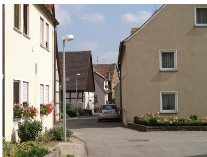
Blick in die Mittelgasse mit ehemaligen jüdischen Häusern.