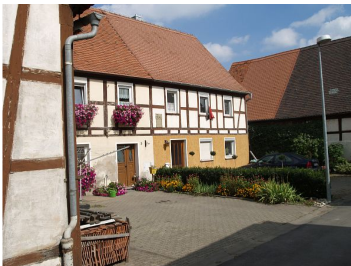
Blick in die Mittelgasse mit ehemaligen jüdischen Häusern.

In Ickelheim bestand eine jüdische Gemeinde seit etwa 1600 bis um 1920. Seit 1887 war Ickelheim eine Filialgemeinde von Bad Windsheim. Jüdische Bewohner am Ort sind seit 1603 bezeugt. Die Nennung eines "Judenschulmeister" 1672 lässt auf eine jüdische Gemeinde mit einem Betsaal schließen.