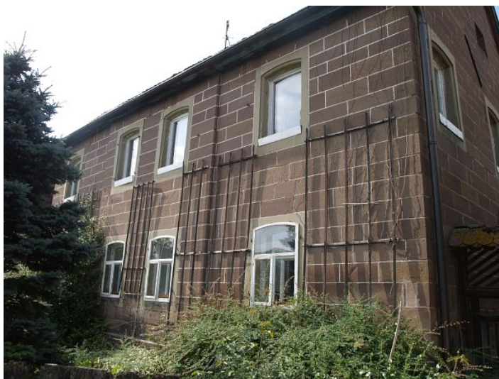
Ehemalige Synagoge Ickelheim.

Bereits Mitte des 17. Jahrhunderts gab es in Ickelheim eine Synagoge. Das Gebäude brannte 1856 ab. Der folgende Neubau ist in seiner Bausubstanz noch heute erhalten.