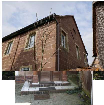
Ehemalige Synagoge Ickelheim.