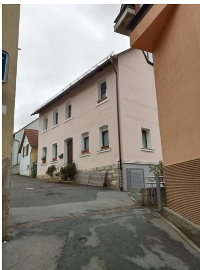
Hüttenbach, Burkhardgasse&nbsp;3, ehem. jüdisches Schulhaus (Aufnahme 2023).

Mitte des 14. Jahrhunderts sollen erstmals jüdische Familien in Hüttenbach gelebt haben, nachweisbar sind sie zumindest vereinzelt ab 1431. Belege aus dem 16. Jahrhundert sind rar, doch ist davon auszugehen, dass jüdische Familien in dieser Zeit dauerhaft in Hüttenbach gelebt haben. Im Jahr 1532 wurde der Ort – wie das nahe gelegene Forth – in seiner Herrschaft aufgeteilt. Daher gab es bis zur Säkularisation sowohl Juden unter dem Schutz der Lochner von Hüttenbach, ab 1662 der Patrizierfamilie Tucher, und andererseits Rothenbergische, die ab 1698 zum Kurfürstentum Bayern gehörten.