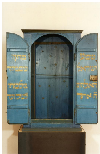
Tora-Schrein aus der Synagoge Hüttenbach.

In einer Vormundschaftsrechnung aus dem Jahr 1619 wird zum ersten Mal eine „Synagog oder Judenschuhl“ erwähnt, für die jährlich eine Steuer von zwei Gulden 30 Kreuzer zu entrichten war. Wahrscheinlich stand sie dort, wo später das Schulhaus errichtet wurde (Burkhardgasse 3). Über Aussehen und Ausstattung ist nichts überliefert. Anfang der 1840er jedoch war sie „sehr beengt und [...] von allen Seiten baufällig“. Zudem erwies sich die Forderung der neuen Mittelfränkischen Synagogenordnung von 1838, dass die Stände durch Sitzbänke (Subsellien) zu ersetzen seien, als nahezu undurchführbar. Daher beschloss die Gemeinde am 19. Oktober 1840 einen Neubau ihres Gotteshauses an der Hauptstraße (heute Haunacher Straße 47).