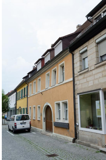
Ehemaliges jüdisches Gemeindezentrum mit Synagoge, Schulräumen und Mikwe; 1900 verkauft und zu einem Wohnhaus umgebaut.

In einem Gebäude (Rosenstraße 8, früher Judengasse) gab es 19. Jahrhundert ein jüdisches Gemeindezentrum mit Synagoge, Schulräumen und einer Mikwe. Nach Israel Schwierz (*1943) erfolgte 1808 der Bau und 1828 wurde auf dem Türstück zur Mikwe die Jahreszahl 1828 angebracht - vermutlich musste die Gemeinde nach den neuen Hygienegesetzen ein neues Ritualbad erbauen bzw. das alte sanieren. Im Jahr 1900 sei das Gebäude verkauft und in ein Wohnhaus umgebaut worden, die Mikwe ist heute zugeschüttet.