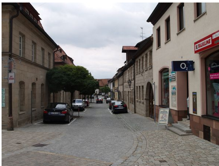
Blick in die Rosengasse, die ehemalige Judengasse.

In Langenzenn bestand von ca. 1535 bis Anfang des 20. Jahrhunderts eine jüdische Gemeinde. Wie die Überblicksseite Alemannia Judaica ausführt, hatte die Gemeinde eine Synagoge, eine Schule und ein rituelles Bad. Die Toten der Gemeinde wurden auf dem jüdischen Friedhof in Fürth beigesetzt. Zur Fürther Gemeinde bestand traditionell eine sehr enge Beziehung. Nachdem die Zahl der jüdischen Gemeindeglieder in der zweiten Hälfte des 19. Jahrhunderts stark zurückgegangen war, bemühten sich die in Langenzenn noch lebenden jüdischen Familien um einen Anschluss an die IKG Fürth . Die Gemeinde Langenzenn ist wenig später aufgelöst worden.