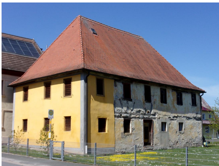
Kairlindach, Kairlindacher Straße 33, ehem. "Judenschule" (Aufnahme 2023).

In Kairlindach gab es seit dem Ende des 17. Jahrhunderts eine kleine jüdische Gemeinde, die 1717 65 Personen umfasste. Über einen Betsaal oder eine Synagoge ist aus dieser Zeit nichts bekannt. 1766 erwarb die Gemeinde im Anwesen 24 (heute Kairlindacher Straße 33) im ersten Stock zwei Kammern, die als Schule und Synagoge genutzt wurden. Das Gemeindezentrum im zweigeschossigen, verputzten Fachwerkbau mit Walmdach, errichtet 1680, wird als "jüdisches Schulhaus 1766-1880" im Bayerischen Denkmal-Atlas aufgeführt.