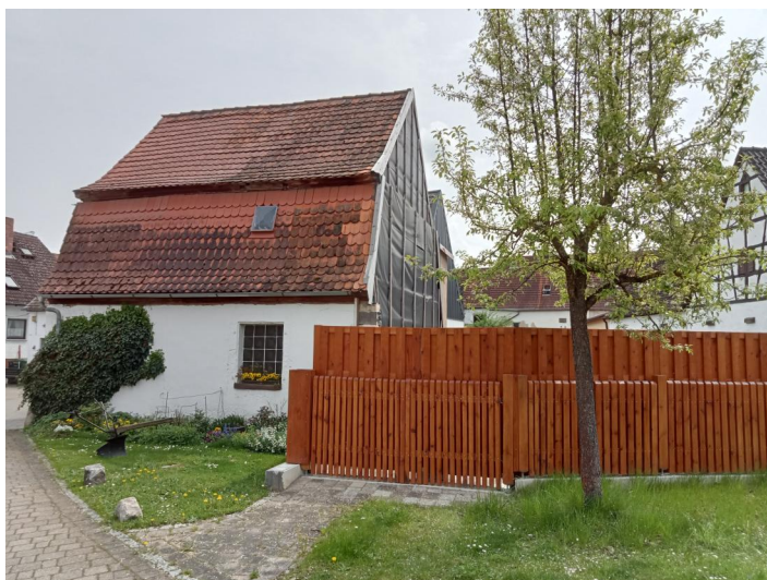
Gebäude der ehemaligen "Judenschule" in Vestenbergsgreuth nach Teilabbruch 2018. In dem Gebäude befanden sich der Betsaal (Synagoge), die Religionsschule und das rituelle Bad der Gemeinde, Aufnahme 2022.

Von einer Synagoge fehlt im 18. Jahrhundert bislang ein Hinweis. Das Vorhandensein einer Synagoge oder ein Betzimmer in einem Privathaus ist allerdings sehr wahrscheinlich, da zu Beginn des 19. Jahrhunderts die jüdische Gemeinde etwa 70 Personen umfasste. Im Geographischen Statistisch-Topographischen Lexikon von Franken (1804) findet sich der erste Hinweis, dass die jüdische Gemeinde in Vestenbergsgreuth eine Synagoge besitzt. Es ist nur zu vermuten, dass dieses Gebäude auch Räumlichkeiten für den Schulunterricht und eine Wohnung besaß. Auch im Geographisch-Historisch-Statistisches Zeitungs-Lexicon von 1811 heißt es, dass unter den Einwohnern des Ortes viele Juden seien, die eine eigene Synagoge hätten.