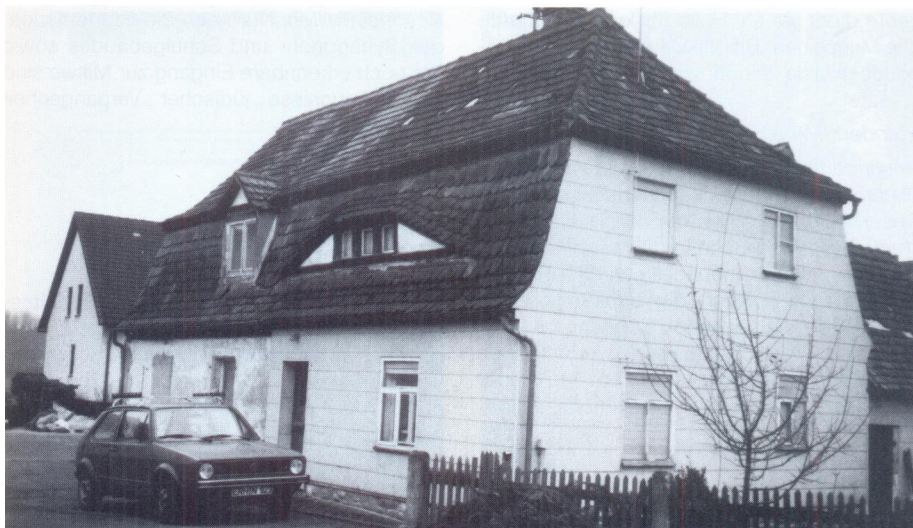
Ehemaliges jüdisches Gemeindezentrum mit Synagoge und Religionsschule, Teile der Synagoge wurden abgerissen (Aufnahme 1980er Jahre).