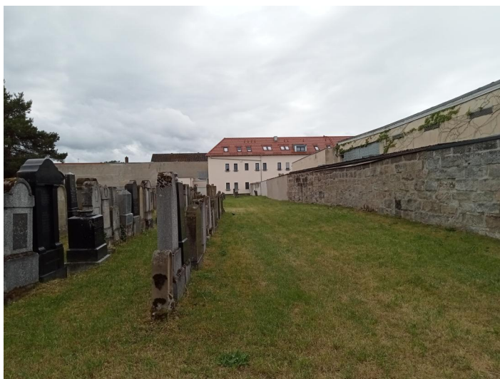
Jüdischer Friedhof Baiersdorf, 2022.

Der jüdische Friedhof befindet sich im Ort, südlich des evangelischen Friedhofs in der Nähe der Judengasse. Er wurde möglicherweise schon Ende des 14. Jahrhunderts angelegt und 1529 als Begräbnisstätte genannt. Über 1100 Grabsteine sind erhalten. Der jüngste Grabstein stammt von 1937. Es finden sich hier auch Rabbinergräber, da Baiersdorf Sitz des Distriktsrabbinats war.