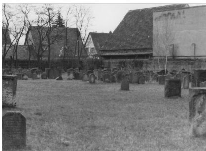
Jüdischer Friedhof Baiersdorf.