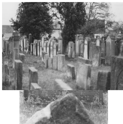
Jüdischer Friedhof Baiersdorf.