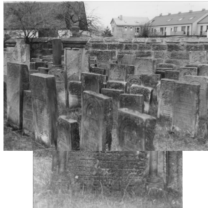
Jüdischer Friedhof Baiersdorf.