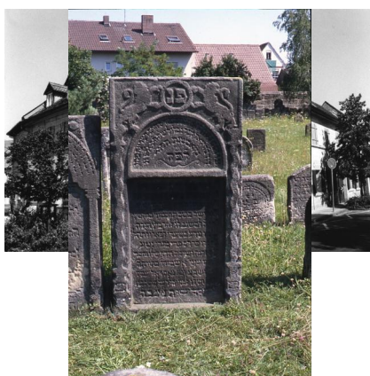
Baiersdorf, Judengasse/Ecke Hauptstraße, Haus der markgräflichen Hoffaktors Samson Salomon (gest. 1712), erbaut um 1700.