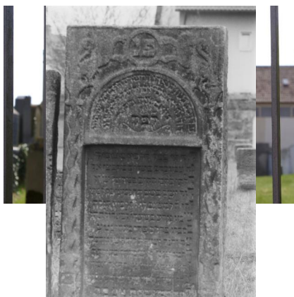
Jüdischer Friedhof Baiersdorf.