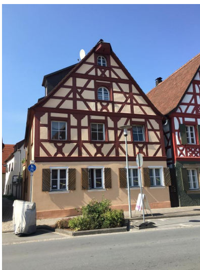
Ehemaliges jüdisches Wohnhaus mit einer Mikwe (Aufnahme 2016).

Eine erste Ansiedlung von Juden erfolgte vermutlich kurz nach der Stadterhebung im Jahr 1353. Der bedeutende jüdische Friedhof wurde nach der Zerstörung und dem Wiederaufbau von Baiersdorf im Städtekrieg 1388 angelegt. Auf ihm ruhen die Verstorbenen aus Orten der Markgrafschaft Brandenburg-Kulmbach (seit 1603: Brandenburg-Bayreuth), des Hochstifts Bamberg, der Reichsstadt Nürnberg und vielen reichsritterlichen Herrschaften. Die Begräbnisgebühren waren eine Einnahmequelle der Landesherren, die daher stets eine schützende Hand über den Ort hielten. Urkundlich ist eine jüdische Gemeinde (Kehillah) erst 1473 erwähnt, die sich jedoch nicht dauerhaft etablieren konnte: Im Jahr 1519 lebte in der Stadt nur noch eine einzige jüdische Familie. Hundert Jahre später waren es wieder neun.