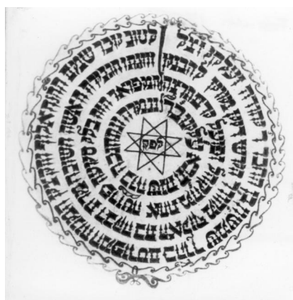
Stiftunginschrift der Synagoge Baiersdorf von 1711, ursprünglich im Eingangsbereich der Männerschul über dem Handwaschbecken angebracht, 1838 zerstört (Ausschnitt aus einem Foto von Theodor Harburger von