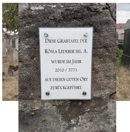
Jüdischer Friedhof Baiersdorf, 2022.