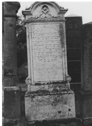
Jüdischer Friedhof Baiersdorf.