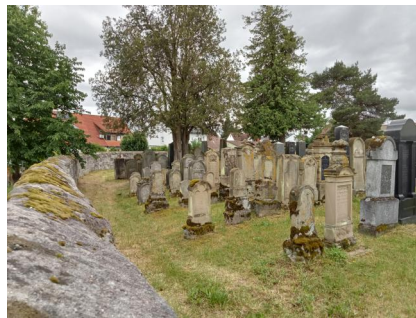
Jüdischer Friedhof Baiersdorf, 2022.