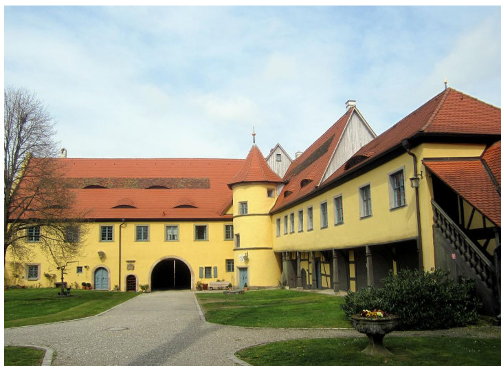
Adelsdorf, Ökonomiehof im Bibra'schen Schloss. Hier soll sich im späten 17. und 18. Jahrhundert eine "Judenkanzlel" befunden haben, in der Nähe des Schlosses stand die Synagoge (Aufnahme 2013).

Der erste schriftliche Nachweis für Juden in Adelsdorf stammt aus einem Lehenbuch des Bamberger Fürstbischofs Anton von Rotenhan (reg. 1431-1459): Im Jahr 1448 erwähnt es in Adelsdorf ein "Gütlein [...] daselbsten Kauffman Jude uffsitzt". Dass in den nächsten Jahrzehnten weitere jüdische Familien nach Adelsdorf zogen, ergibt sich aus der Abschrift einer Gemeindeordnung von 1515. Sie verlangte von jedem erwachsenem Juden ein "Einzugsgeld" von zwei Gulden. Wohl um diese Zeit wurde in der Nähe des Dorfes Zeckern ein jüdischer Friedhof angelegt, den auch die Familien im rund zwei Kilometer entfernten Adelsdorf benutzten.