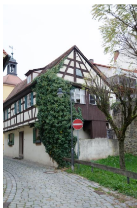
Die ehemalige Synagoge Windsbach, 2013.