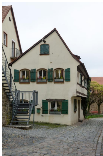
Die ehemalige Synagoge Windsbach, 2013.

Eine erste Synagoge ist im Urbar der Nürnberger Burggrafen für das Jahr 1360 nachweisbar. Ihr Standort und Aussehen sind jedoch unbekannt. 1707 mussten die jüdischen Haushaltsvorstände vor dem Stadtrat erscheinen und sich wegen eines behördlich nicht genehmigten Gotteshauses rechtfertigen. Dabei handelte es sich jedoch nach Angaben der Gemeinde um einen privaten Betsaal im oberen Stock des Hauses von Moses Neumark, der fast nie benutzt wurde. Mit sechs bis sieben Männern kam in Windsbach noch kein Minjan zustande, und nur beim Aufenthalt fremder Juden wurde Gottesdienst gefeiert. 1727 existierte eine Synagoge mit Torarolle im Ort, doch auch über dieses ist nichts weiter bekannt.