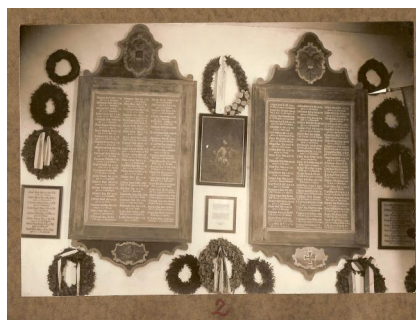
Dinkelsbühl, Dreikönigskapelle mit militärischen Ehrentafeln (Aufnahme um 1925). Copyright Stadtarchiv Dinkelsbühl, A10 106a2