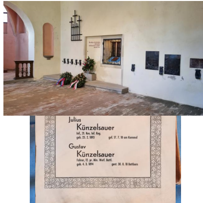
Dinkelsbühl, Ehrenbuch der Stadt mit den Namen der Kriegstoten (Aufnahme 2023).

Das Ehrenbuch ist in geprägtes Leder gebunden und nicht im Handel erhältlich.