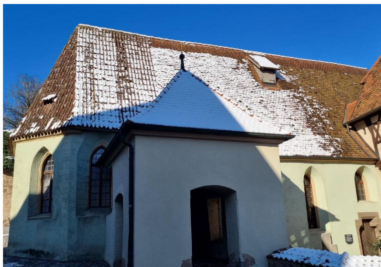
Dinkelsbühl, Dreikönigskapelle, im Vordergrund der mit einem Walmdach überdeckte Stumpf des abgegangenen Kirchturms (Aufnahme 2023).

In Dinkelsbühl befindet sich im überdachten Stumpf des abgegangenen Glockenturms der Dreikönigskapelle eine Gedenkstätte. Sie erinnert allgemein an die Kriegstoten von 1870/71, 1914/18 und 1939/45. Zusätzlich wurde im Fenster ein mehrsprachiges Mahnmal für die Opfer der Shoah angebracht. Schon lange dient das mittelalterliche Gotteshaus als "Kriegergedächtniskapelle": Neben Regimentsfahnen aus dem 19. Jahrhundert hingen in den 1920er Jahren diverse Namenstafeln der Dinkelsbühler Gefallenen an den Wänden, heute mehrheitlich verschollen. Das städtische Ehrenbuch wird in der Kapelle aufbewahrt, die jährlich zum Volkstrauertag öffnet.