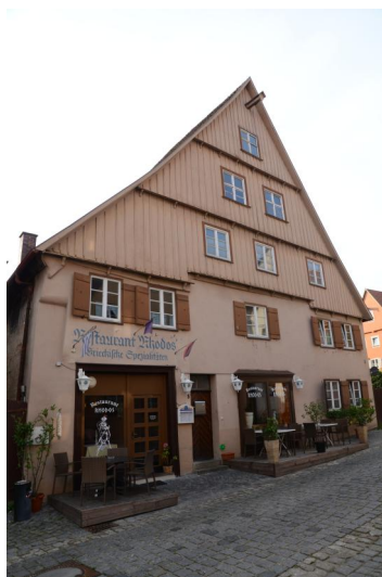
Jüdisches Wohnhaus, in dem zu Beginn des 20. Jahrhunderts der Religionsunterricht abgehalten wurde.

Seit 1274 war Dinkelsbühl eine freie Reichsstadt und nur dem Kaiser unterstellt. Im Gegensatz zu landständischen Orten konnte dadurch kein regionaler Herrscher die städtische Judenpolitik beeinflussen. Im Hochmittelalter lebten immer wieder vereinzelt jüdische Familien im Ort, doch in den fränkischen Pogromen der Jahre 1298 („Rindfleisch-Verfolgung“) und 1348/49 wurden sie wieder vertrieben. Am 2. März 1372 beurkundete Kaiser Karl IV. (reg. 1346/49-1378) der Stadt das Recht, Juden zu „haben, halten, empfangen, schützen und schirmen“. Im Folgejahr gewährte Karl den Dinkelsbühler Juden als Dank für ihre finanzielle Unterstützung vier Jahre Steuerfreiheit und verlängerte 1376 das Dinkelsbühler Privileg auf weitere zehn Jahre, wofür die Hälfte der Schutzgelder an die kaiserliche Schatzkammer abzuführen war. Die ortsansässigen Juden lebten insbesondere vom Geldverleih, da ihnen der Zugang zu den „ehrlichen“, das heißt zunftmäßig organisierten Berufen verwehrt blieb. 1384/85 beschlagnahmte die Stadt gewaltsam die Schuldbriefe und Pfänder, woraufhin viele Juden flohen und sich dem Schutz der Grafen von Oettingen unterstellten. Bis 1390 scheint sich die Gemeinde vollständig aufgelöst zu haben.