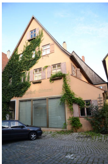
Ehemaliges jüdisches Wohn- und Geschäftshaus, Klosterergasse 5, bis 1938 wurden zwei Räume als Synagoge genutzt.

Über ein mittelalterliches Gotteshaus ist nichts bekannt. Wahrscheinlich versammelten sich die Juden von Dinkelsbühl in einem privaten Betraum, von dem sich aber keine Spuren erhalten haben.