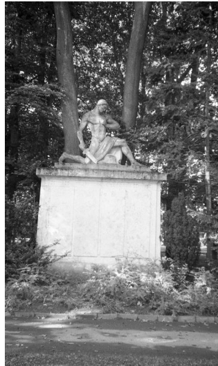
Schwabach, Kriegerdenkmal im Stadtpark (Aufnahme Israel Schwier, 1996). Copyright BayHStA, BS N 80 80/92-02A

In der Stadt Schwabach befindet sich das Kriegerdenkmal für die Gefallenen des Ersten Weltkrieges im nordwestlichen Teil des Stadtparks, unweit der Eisentrautstraße (gut zu finden auch von der Bahnhofstraße aus, wo das Denkmal über einen Eingang zwischen zwei bayerischen Löwen zu erreichen ist).