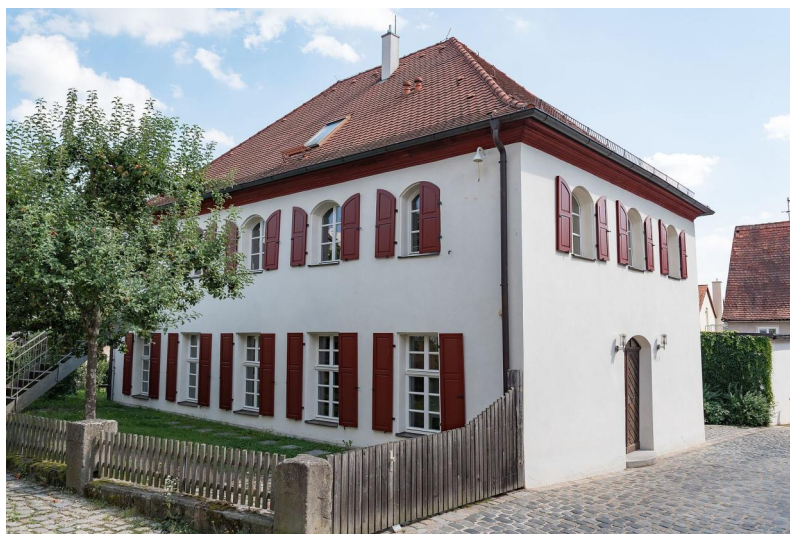
Schwabach, Synagogengasse 6, ehem. Synagoge mit VHS-Seminarraum (Aufnahme 2016).

Eine handschriftliche Quelle beschreibt ein großes Feuer in Schwabach, dem 1540 die erste Synagoge zum Opfer gefallen war: „Prunst Tzu Schwabach. Jm 1540 Verpronn der Juden Schuel unnd Hauß zZu Schwabach unnd wurd niemandts kein versetzt guet wider.“ Der Standort und die bauliche Gestalt dieses Gotteshauses sind nicht bekannt. Die wechselvolle Judenpolitik der Ansbacher Markgrafen und später der Ausbruch des Dreissigjährigen Krieges machten einen Neubau lange unmöglich, Gottesdienste fanden nur in privaten Beträumen statt. Erst 1685 konnte die Schwabacher Kultusgemeinde im Nordosten der Stadt einen großen Bauplatz erwerben. Zwei Jahre später entstand hier eine Synagoge mit Vorhof (Synagogengasse 6), und auf der gegenüberliegenden Seite ein Rabbinerhaus (Synagogengasse 7). Das Gotteshaus besaß einen rechteckigen Grundriss und vermutlich eine Toranische an der östlichen Schmalseite.