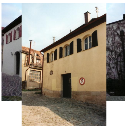
Die ehemalige Synagoge Schwabach nach Abschluß der Restaurierungsarbeiten