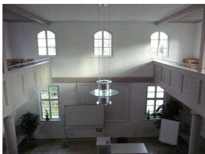
Innenansicht der ehemaligen Synagoge in Schwabach nach Abschluss der Restaurierungsarbeiten.