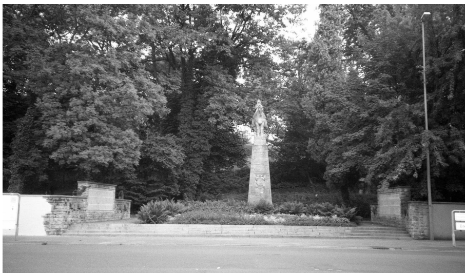
Kulmbach, Kriegerdenkmal für die Gefallenen beider Weltkriege auf dem Alten Friedhof.

Das Denkmal für die Gefallenen der Stadt Kulmbach aus beiden Weltkriegen steht am Rande des alten Friedhofes in der Pestalozzistraße. In der Mitte der gepflegten Anlage steht ein Reiterstandbild mit den Jahreszahlen 1914–18 und 1939–45.