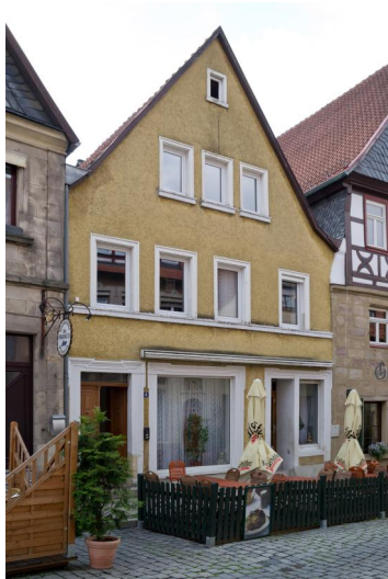
Ehemaliges jüdisches Wohnhaus, Lucas-Cranach-Str. 4

Einige Juden aus Kronach fielen bereits 1298 dem Rintfleischpogrom zum Opfer. Sie sind in dem Nürnberger Memorbuch, das ab 1296 in Gebrauch war, namentlich erwähnt. Gerichtsakten aus den Jahren 1387 bis 1403 dokumentieren Klagen Kronacher Juden gegen säumige Schuldner. Sie wohnten wohl damals schon in der Judengasse im Westteil der oberen Stadt, die zwar erst im 16. Jahrhundert so genannt wurde, aber vermutlich schon im Mittelalter existiert hatte. Ende des 14. und Mitte des 15. Jahrhunderts sind vier bis fünf jüdische Familien im Ort nachgewiesen. Auch in anderen fränkischen Städten gibt es aus dieser Zeit Nachrichten über Juden aus Kronach. Um 1478 wurden aber alle Juden aus dem Hochstift Bamberg vertrieben.