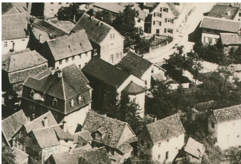
Luftbildaufnahme der Rückansicht der Synagoge um 1930. Auf dem Dachfirst sind die beiden Zehn-Gebote-Tafeln zu erkennen, die 1938 entfernt wurden.

In Kronach gab es bis 1883 keine Synagoge. Die kleine jüdische Gemeinschaft versammelte sich ab 1685 in dem am Marktplatz gelegenen Haus Nr. 45 (heute mit der Stadtverwaltung Marktplatz 5 überbaut). 1711 wurde im Anwesen Nr. 22 (heute Amtsgerichtsstraße 25) eine Betstube eingerichtet und zunächst bis 1725 genutzt. Dann wechselte sie wieder für zehn Jahre an die erste Adresse, und von 1735 bis 1863 (eventuell sogar bis 1872) erneut in die Nr. 22. Anschließend fanden die Gottesdienste bis 1876 in der evangelischen Knabenschule statt und für die nächsten drei Jahre in der protestantischen Mädchenschule, die in der Alten Fronfeste lag. Bis zur Fertigstellung der Synagoge 1883 traf man sich vermutlich in einem Saal des Gasthofs „Reichsadler“.