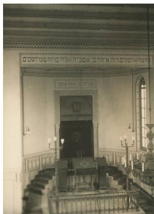
Innenansicht der Synagoge in Kronach Mitte der 1920er-Jahre mit Tora-Schrein und Almemor.