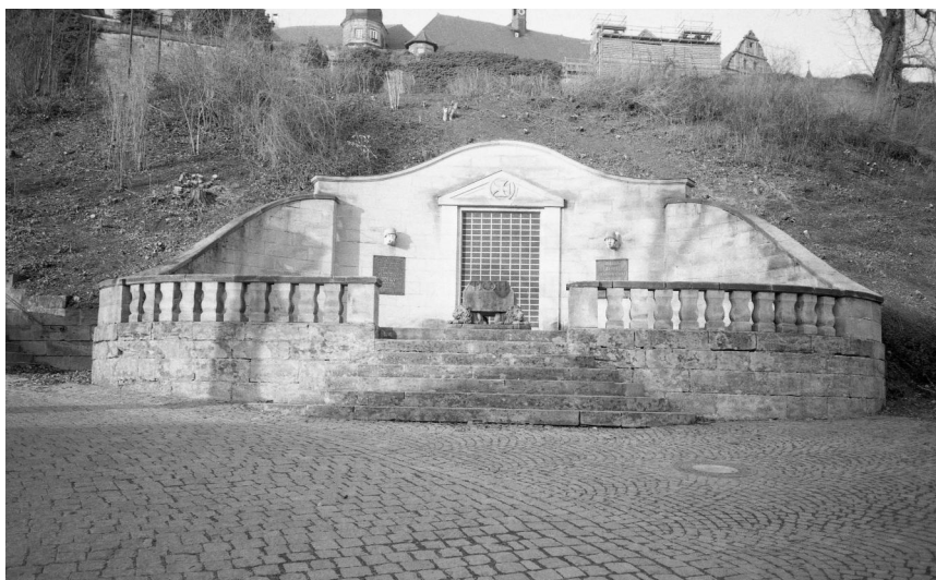
Kronach, Kommunales Denkmal für die Gefallenen des Ersten Weltkriegs (Aufnahme Israel Schwierz, 1996). Copyright BayHStA, BS N 80 80/78-32A

Das im Jahre 1935 errichtete Kriegerdenkmal der Stadt Kronach befindet sich unterhalb der Festung Rosenberg (die Straße von der Oberen Stadt zur Festung führt direkt daran vorbei).