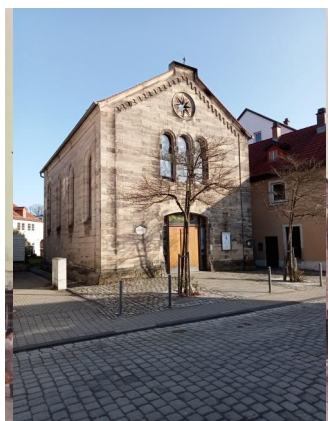
Ansicht des Synagogengebäudes aus den 1960er-Jahren, als es vom Roten Kreuz als Sanitätsdepot verwendet wurde.