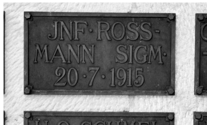
Kronach, Tafel am Kriegerdenkmal mit dem Namen von Julius Rossmann.