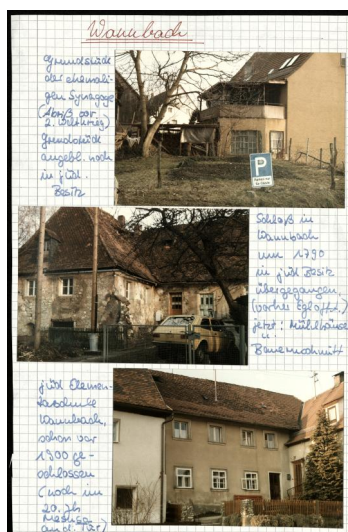
Wannbach, ehem. Synagogengrundstück, jüdische Wohnstätten im Egloffsteiner Schloss sowie jüdische Elementarschule, aus den Forschungsergebnissen von Prof. Klaus Guth (Aufnahmen 1986).