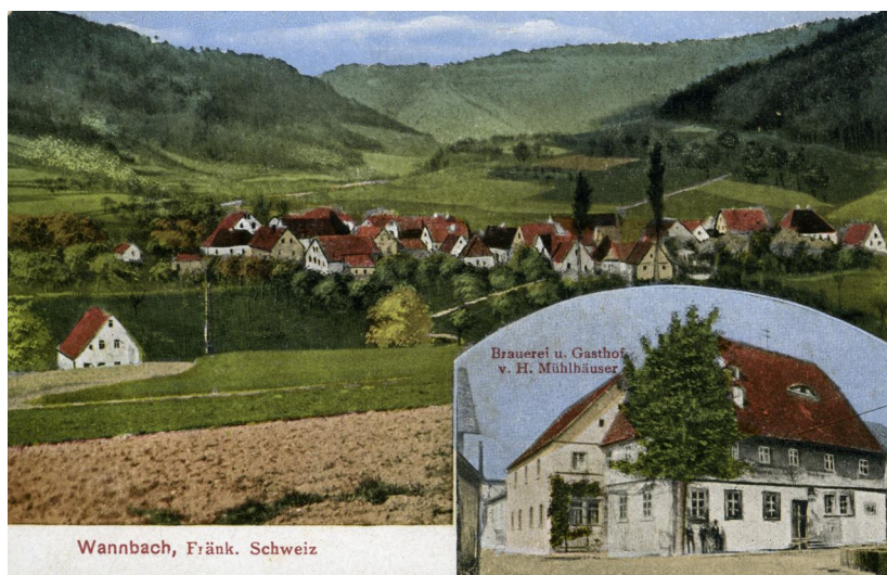
Postkarte mit Gesamtansicht von Wannbach mit Synagoge, Brauerei und Gasthof von H. Mühlhäuser, 1930.

Die Grafen Seinsheim siedelten in der zweiten Hälfte des 18. Jahrhunderts jüdische Familien im Bereich des Alten Schlosses an. Hier wurde um 1770 im Hofbereich die Synagoge erbaut (heute Grundstück bei Haus Nr. 25).