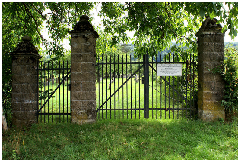
Eingangstor des jüdischen Friedhofs Hagenbach.

Der jüdische Friedhof liegt ungefähr einen halben Kilometer südwestlich des Dorfes und ist über einen Feldweg erreichbar. Er hat eine Größe von fast 4000 qm und ist 1737 eingeweiht worden. Die letzte Beerdigung fand 1934 statt. Es sind noch fast 400 Grabsteine erhalten.