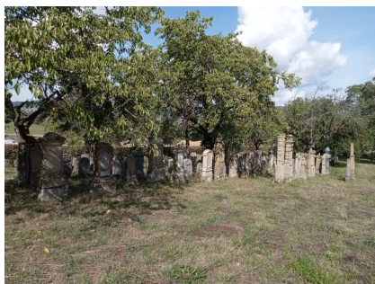
Der jüdische Friedhof Hagenbach, 2022.

Schändungen: 1941 plante man, den Friedhof mit Maulbeerbäumen für eine Seidenraupenzucht zu bepflanzen; hierzu kam es jedoch nicht mehr.