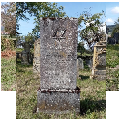
Der jüdische Friedhof Hagenbach, 2022.