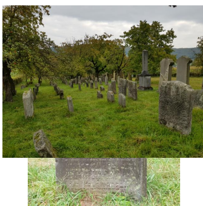
Jüdischer Friedhof Hagenbach, 2020.