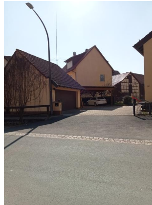
Standort des Gebäudes des ehemaligen Synagoge, Hagenbach 37 (Aufnahme 2022). Das Synagogengebäude wurde 1939 abgebrochen.