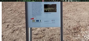
Informationstafel an der Dachstadter Straße zur Geschichte der jüdischen Gemeinde in Ermreuth (Aufnahme 2022).