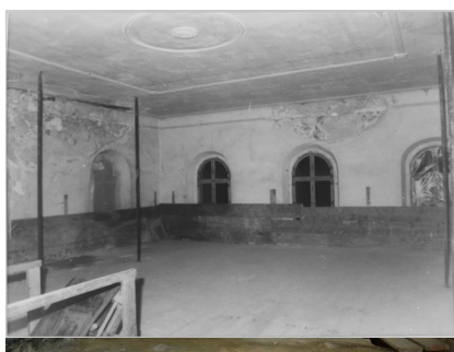
Ermreuth, Ostseite der ehem. Synagoge mit Toranische (Aufnahme 1986).