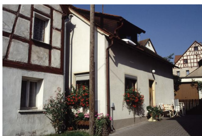
Ehemaliges Wassermann-Haus in Ermreuth.