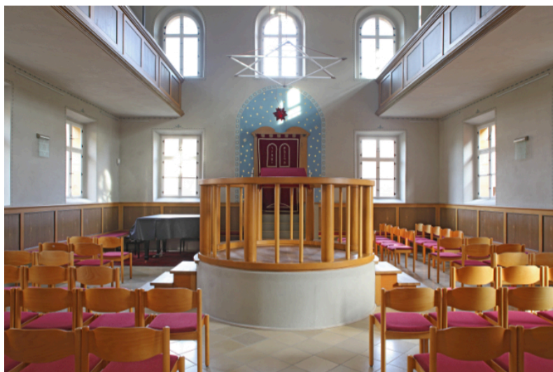
Innenansicht der Synagoge Ermreuth.

1738 stellte die Gutsherrschaft der jüdischen Gemeinde einen Platz am Ortsrand (heute Wagnergasse 8, Flur-Nr. 48) für den Bau einer Synagoge zur Verfügung. Vermutlich wurde dieses Gotteshaus als Fachwerkbau errichtet. Durch den großen Mitgliederzuwachs war Anfang des 19. Jahrhunderts eine Erweiterung dringend notwendig geworden. Deshalb erwarb Joseph Reichhold 1817 ein angrenzendes Grundstück. Man entschied sich dann aber nicht für die bloße Vergrößerung des Betsaals sondern für einen Neubau. Es wurde ein aufwendiges zweigeschossiges Werksteinhaus über rechteckigem Grundriss in detailreicher klassizistischer Formensprache errichtet und an seiner Ostseite ein Toraerker angebracht.