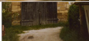
Ermreuth, Betsaal der ehem. Synagoge vor der Restaurierung mit leerer Toranische (Aufnahme um 1985).