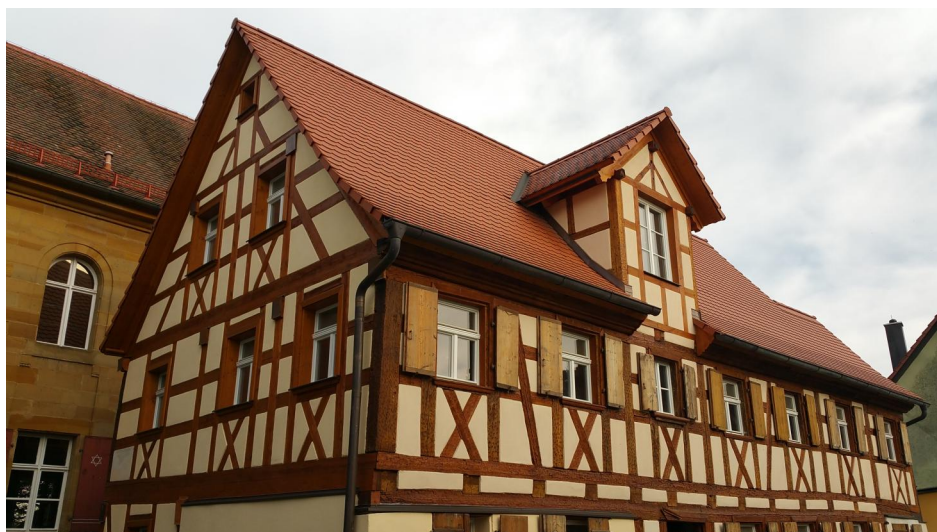
Ehemaliges Schwarzhaupt-Haus in Ermreuth.

Ein erster Hinweis auf die Anwesenheit von Juden in Ermreuth findet sich in der Chronik des Uso von Künßberg aus dem Jahr 1554. Eventuell kamen jedoch schon 1498/99 nach der Vertreibung der Juden aus der Reichsstadt Nürnberg einige Flüchtlinge in den Ort. Die Ermreuther Gemeindeordnung von 1696/98 stellt die erste sichere Quelle für ihre Existenz dar. Rund acht jüdische Familien lebten damals hier. Bis 1770 stieg deren Zahl auf 25 Haushalte. Ein jüdischer Friedhof wurde 1711 rund zwei Kilometer nördlich des Dorfes am sog. Heimbühl angelegt. Er wurde in der Folgezeit zweimal (1797 und 1864) erweitert. Bis heute haben sich darin 223 Grabmäler erhalten. Das älteste ist 1718/19 datiert.