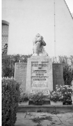
Ermreuth, kommunales Kriegerdenkmal 1914-18 und 1939-45 (Aufnahme 1996).

Das Kriegerdenkmal für die Gefallenen beider Weltkriege aus Ermreuth befindet sich unmittelbar vor der evang.-luth. Kirche St. Peter und Paul.