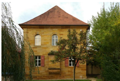
Synagoge Ermreuth - Dauerausstellung auf der Empore.