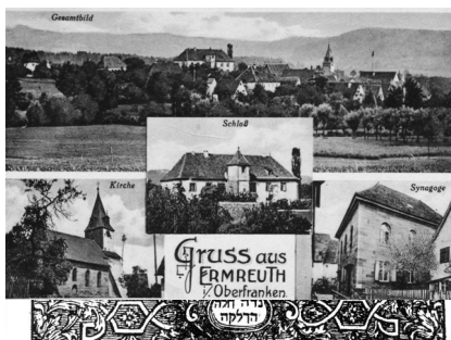
Ermreuth, Genisafund in der ehemaligen Synagoge: Holzschnitt als Schutzamulett für ein neugeborenes Mädchen gegen die Dämonin Lilith.