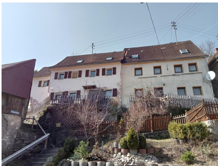
Am Aufgang Burgsteig befinden sich in der Gasse (ehemals Judengasse) sogenannte "Tropfhäuser" (Aufnahme 2022), die von jüdischen und christlichen Familien bewohnt waren. Das Tropfhaus hatte soviel Grund um das Haus, wie unter die Regenrinne (Tropf) passte.

Die ersten Spuren von jüdischen Familien in Egloffstein gehen auf ein Salbuch des Jahres 1727 zurück, in dem ihre Verpflichtung zur Bezahlung von Stolgebühren an den Ortspfarrer festgehalten wird. Sie standen unter dem Schutz der reichsunmittelbaren Freiherren von Egloffstein. Die jüdische Gemeinde blieb relativ klein, archivalische Spuren sind recht spärlich gesät. Die Matrikellisten der 1820er Jahre weisen sieben Stellen aus, noch 1834 umfasste die Kultusgemeinde nur 30 Personen bei einer Gesamtbevölkerungszahl von 541 Personen. Die Matrikel aus der ersten Hälfte des 19. Jahrhunderts weisen eine Handelstätigkeit in Egloffstein und Umgebung mit Altkleidern, Schnittwaren, Eisenwaren und Viehhandel nach.