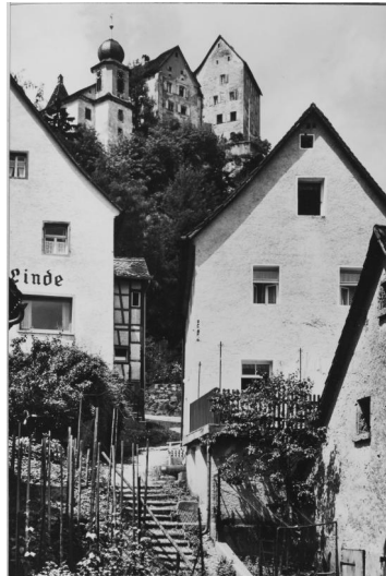
Egloffstein, ehemalige Synagoge (rechts) nach dem Umbau (Aufnahme 1955).