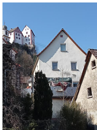
Gebäude der ehemaligen Synagoge Egloffstein, Malerwinkel 89 (Aufnahme 2022).

Die Gottesdienste der kleinen Kultusgemeinde fanden in einem jüdischen Tropfhaus statt, das 1808 der Witwe Männlein gehörte (Anwesen Nr. 91, heute Malerwinkel 89). Die Gemeinde besaß das verbriefte Recht, hier auch Schulunterricht zu halten. Schul- und Betsaal waren ein einziger Raum im Erdgeschoß. Wie auf historischen Abbildungen zu erkennen, befand sich an der Südostwand eine Tora-Nische. Bereits 1866 wurde das Synagogengebäude als "ruinös" bezeichnet. Der Reparaturbedarf betrage 300 Gulden, außerdem sei das Haus mit einer Hypothek von 150 Gulden belastet. Um 1900 nutzte ein privater Kindergarten das Gebäude, neue Eigentümer ließen im Jahr 1940 die Auskrugung der Tora-Nische entfernen und die Mauer begradigen.