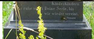
Jüdischer Friedhof Aufseß, 2022.