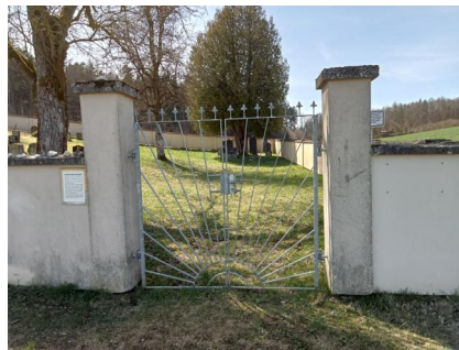
Jüdischer Friedhof Aufseß, 2022.