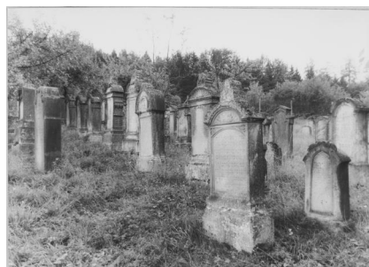
Aufseß, jüdischer Friedhof (Aufnahme 1986).