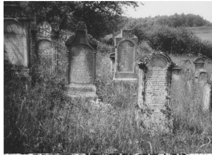
Jüdischer Friedhof Aufseß.