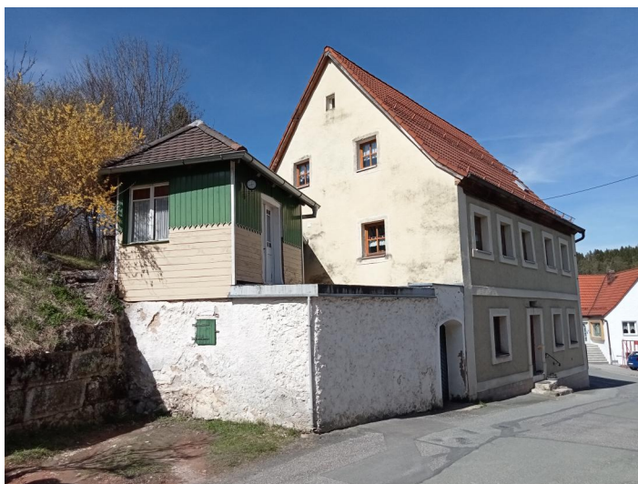
Kirchberg 21, sogenanntes Schächterhaus, 2022.