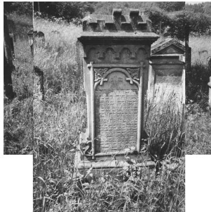
Jüdischer Friedhof Aufseß.