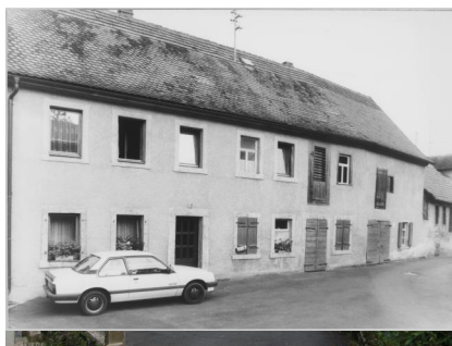
Aufseß, Reste der Mesusa am "Schächterhaus" (Aufnahme 1986).