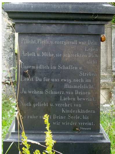
Grabstein mit einem Lobgedicht in deutscher Sprache.

Der jüdische Friedhof in Aufseß wurde 1722 angelegt. Er liegt nordwestlich des Orts an einem Hang und hat eine Größe von fast 1200 qm. Es sind 143 Grabsteine erhalten. Das Einzugsgebiet reichte zeitweise bis nach Bayreuth. Die letzte Beerdigung fand 1938 statt.