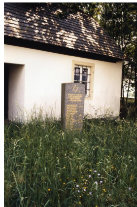
Jüdischer Friedhof von Aschbach.