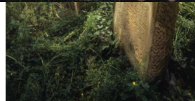
Jüdischer Friedhof von Aschbach.