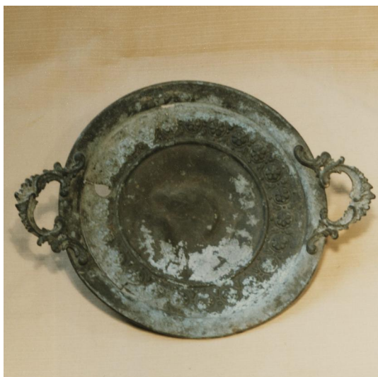
Aschbach, Genisa-Fund aus der Synagoge: Sederplatte (Aufnahme 1986).

Zwischen 1531 und 1541 werden in "Aßpach" erstmals Juden erwähnt. Nachdem die katholische Linie der Freiherren von Pölnitz gegen Ende des 17. Jahrhunderts den Ort erworben hatte, ermöglichten sie die Ansiedlung von Katholiken und Juden. Letzteren wurde die "Judengasse" (heute Bachgasse) am südlichen Ortsrand zugewiesen. Erste Zeugnisse über die Anwesenheit der Juden im Dorf betreffen vor allem deren Friedhof, dessen ältester Grabstein wohl aus dem Jahr 1720 stammt, und der von 1725 bis 1775 auch von der jüdischen Gemeinde aus Burghaslach genutzt wurde. Aus einem Schutzbrief aus dem Jahr 1728 geht hervor, dass einige Jahre zuvor eine neue Synagoge errichtet und auch für Schulzwecke genutzt wurde. Ein separates jüdisches Matrikelbuch war ab 1731 in Gebrauch.