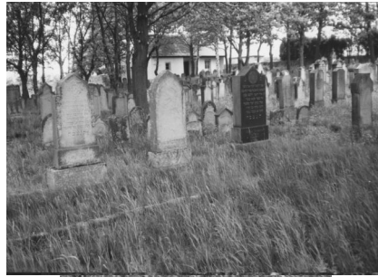
Jüdischer Friedhof Aschbach.