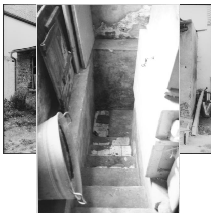
Aschbach, Bachgasse 8 und 10 (links), ehemalige Synagoge und jüdische Schule, gegenüber im Flachbau Reste der Mikwe von 1913 (Aufnahme 1986).