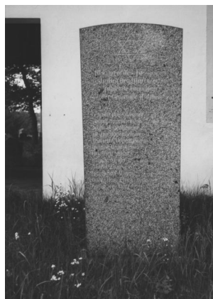
Jüdischer Friedhof Aschbach.