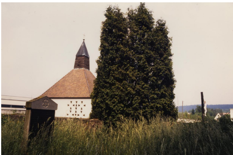
Jüdischer Friedhof von Aschbach.

Der jüdische Friedhof Aschbach liegt am Ortsrand in der Nähe des kommunalen Frieschofs. Er wurde wahrscheinlich Anfang der 18. Jahrhunderts angelegt und seit 1725 von der jüdischen Gemeinde Burghaslach mit genutzt. Er hat eine Größe von über 3000qm und ist von einer Mauer umgeben. Es sind noch etwa 350 Grabsteine erhalten.