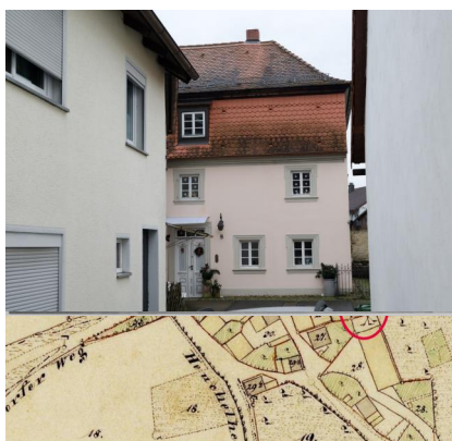
Aschbach, Uraufnahme 1808-1864 (Ausschnitt). Die Synagoge mit Lehrerwohnung ist rot markiert.