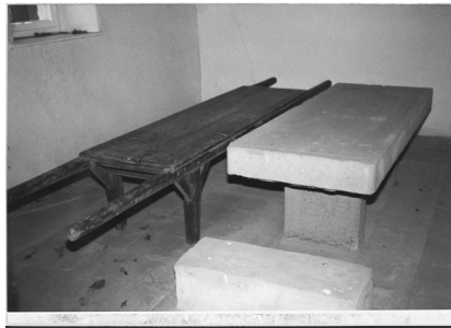
Aschbach, jüdischer Friedhof (Aufnahme 1986).