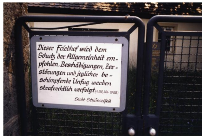
Jüdischer Friedhof von Aschbach.