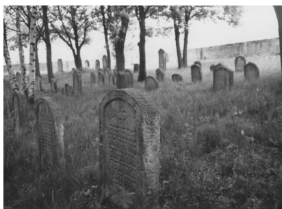
Jüdischer Friedhof Aschbach.