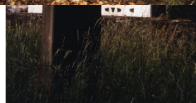
Jüdischer Friedhof von Aschbach.