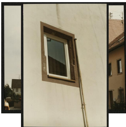
Trunstadt, Altes Zehnt- bzw. Vogteihaus in Trunstadt, spätere Synagoge, Schule und Mikwe der jüdischen Gemeinde (Aufnahme um 1985).