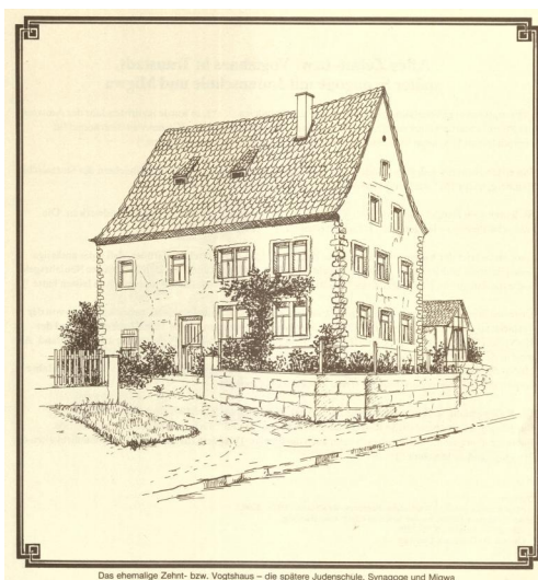
Trunstadt, Altes Zehnt- bzw. Vogteihaus in Trunstadt, spätere Synagoge, Schule und Mikwe der jüdischen Gemeinde (Kalenderillustration)

Der Hinweis in einer Pfarreibeschreibung, dass es in Trunstadt neun jüdische Familien und eine Synagoge gebe, ist der erste Hinweis. Die Synagoge ist nicht zu lokalisieren. Es wird bislang ausgeschlossen, dass der Standort des Nachfolgebau identisch ist. Auch eine Verbindung einer möglichen Ausmalung durch den Wandermaler Eliezer Sussmann ist bloße Spekulation. Der Synagogenbau des 19. Jahrhunderts war die ehemalige Vogtei, deren Bausubstanz bis in das 16./17. Jahrhundert zurückreicht. Nachdem das Amtsgebäude zunächst zu Wohnungen umgewidmet wurde, wird 1810 bereits die "Judenschul" erwähnt.