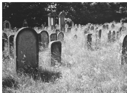
Jüdischer Friedhof Zeckendorf.