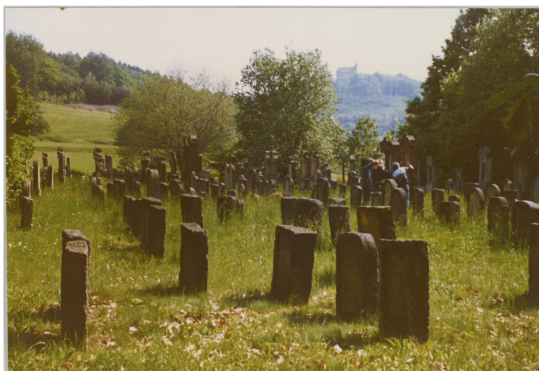
Zeckendorf, jüdischer Friedhof (Aufnahme um 1980).

Der jüdische Friedhof liegt 800 m nördlich von Zeckendorf auf einer Anhöhe rechts oberhalb der Straße nach Demmelsdorf am Waldrand. Er hat eine Fläche von fast 5000 qm und wurde 1617 angelegt. Es sind noch fast 600 Grabsteine erhalten.