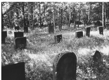
Jüdischer Friedhof Zeckendorf.