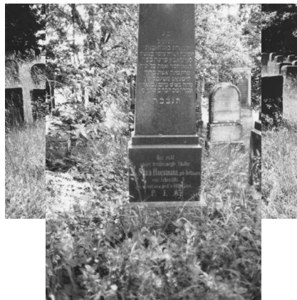
Jüdischer Friedhof Zeckendorf.