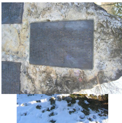
Gedenkstein für die Opfer der jüdischen Gemeinden Demmelsdorf, Scheßlitz und Zeckendorf.