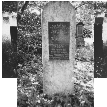
Jüdischer Friedhof Zeckendorf.