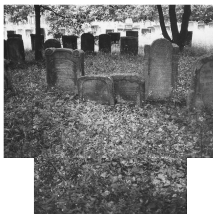
Jüdischer Friedhof Zeckendorf.