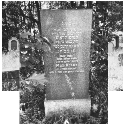
Jüdischer Friedhof Zeckendorf.