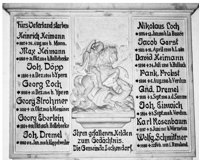
Zeckendorf, Kriegerdenkmal mit dem Hl. Georg in der "Gügelkirche" (Aufnahme Israel Schwier, 1996). Copyright BayHStA, BS N 80 80/77-15A

Das Kriegerdenkmal für die Gefallenen beider Weltkriege von Zeckendorf - heute ein Ortsteil von Scheßlitz - ist in der „Gügelkirche“ auf einem Berg ca. 2 km außerhalb des Dorfes in Richtung Oberlangenstadt zu finden. Die Gedenkstätte befindet sich gegenüber der Tür des Seiteneinganges, durch den man in die Kirche gelangen kann, rechts einer Lourdes-Grotte.