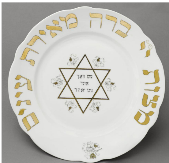
Der um 1920 gefertigte Teller trägt in der Mitte in hebräischen Lettern die jüdische Inschrift "Gut Woch' und gut' Jahr". Der Teller wird bei der Hawdalazeremonie am Ausgang des Sabbats verwendet. Er stammt wahrscheinlich aus dem Besitz eines Mitglieds der Gemeinde von Zeckendorf.