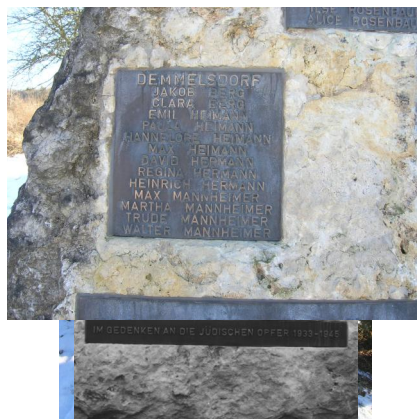
Gedenkstein für die Opfer der jüdischen Gemeinden Demmelsdorf, Scheßlitz und Zeckendorf.