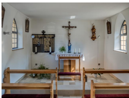
Demmelsdorf, Blick in die Dorfkapelle St. Wendelin mit der Gedenktafel (Aufnahme 2016).