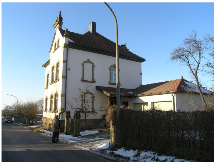
In dem kleinen Anbau (rechts im Bild) an der ehemaligen Volksschule wurde jüdischer Religionsunterricht erteilt (Aufnahme 2005).

Bereits im 13. Jahrhundert sind Juden im Bamberger Land nachweisbar; die erste schriftliche Quelle für Demmelsdorf (heute ein Gemeindeteil von Scheßlitz ) stammt aus dem Jahr 1586: Damals beanstandete der fürstbischöfliche Vogt Friedrich Sebeer die immer größer werdende jüdische Bevölkerung in Zeckendorf und erwähnte in diesem Zusammenhang auch einen Demmelsdorfer Juden. Im Jahr 1617 erhielten die Juden aus Demmelsdorf und Zeckendorf vom Reichsritter Hans Mathias von Giech die Erlaubnis, auf seinem Grund an einem Hügel zwischen ihren beiden Dörfern einen Friedhof anzulegen. Noch im gleichen Jahr bestätigte der Bamberger Fürstbischof als Lehensherr diese Erlaubnis.