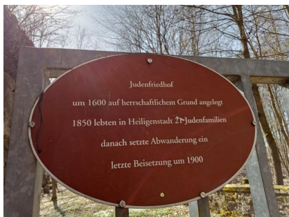
Eingang zum jüdischen Friedhof Heiligenstadt, 2022.