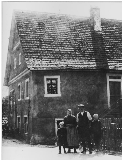
Heiligenstadt, jüdisches Privathaus mit Synagoge im Obergeschoss (Aufnahme Ende 19. Jahrhundert).