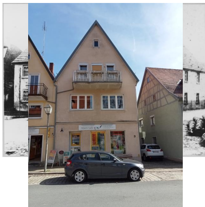
Heiligenstadt, Hauptstraße mit der jüdischen Warenhandlung Weidel hinten links (Aufnahme um 1900).