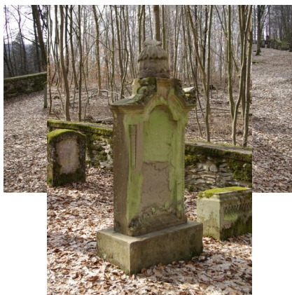
Jüdischer Friedhof, mit gemauerter Einfriedung, Grabsteine 18./19. Jh.