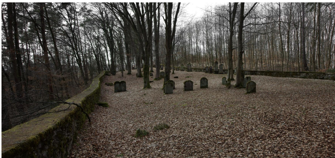
Jüdischer Friedhof, mit gemauerter Einfriedung, Grabsteine 18./19. Jh.

Der jüdische Friedhof liegt nordöstlich von Heiligenstadt im Waldstück „Im Köhlich“ dicht am Hang. Er hat eine Größe von über 2200 qm und wurde um 1700 angelegt. Die letzte Beisetzung erfolgte 1895.