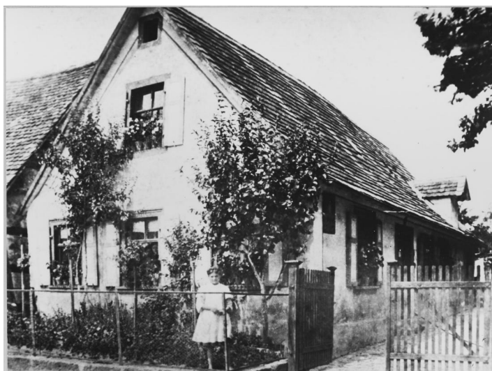
Heiligenstadt, jüdisches Wohnhaus (Aufnahme Ende 19. Jahrhundert).

Der erste gesicherte Nachweis von Juden in Heiligenstadt stammt aus dem Jahr 1617: In einer Urkunde der Streitberger Grundherrschaft werden fünf abgabepflichtige Juden im Ort genannt. Die Nachrichten aus dem 17. und 18. Jahrhundert sind spärlich und schwer überprüfbar. Für 1699 gibt es eine Notiz, dass sich christliche Scheßlitzer und Heiligenstädter Bürger an einem Pogrom gegen die jüdische Gemeinde beteiligt hätten. Nachdem wenige Jahrzehnte später ein christliches Mädchen von unbekanntem Tätern ermordet wurde, fürchteten die Heiligenstädter Juden ein erneutes Pogrom und baten ihre Grundherrschaft um Schutz.