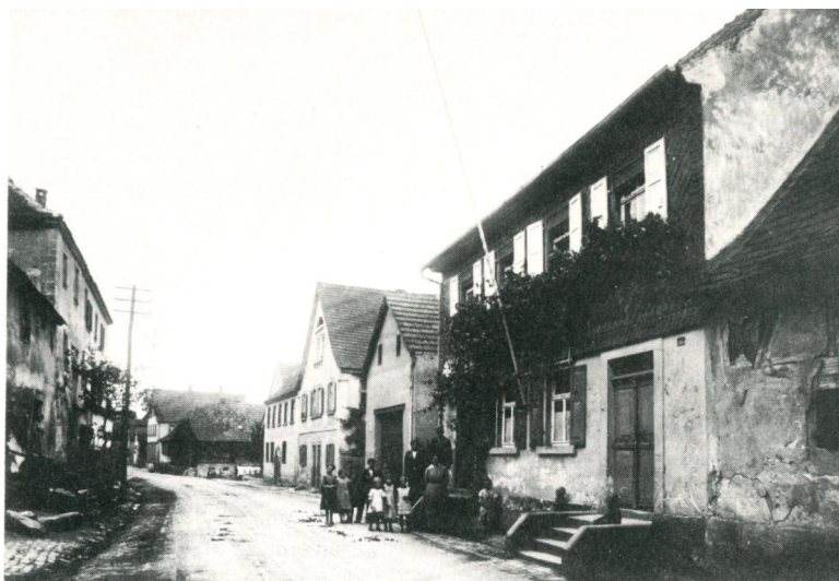
Dorfstraße in Bischberg um 1910.

Copyright Klaus Guth, Jüdische Landgemeinden in Oberfranken 1800-1942, Bamberg 1989, S. 111