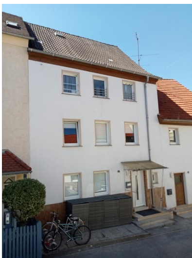
Im Gebäude Hauptstraße 84 befand sich bis zu Beginn des 20. Jahrhunderts die Synagoge. Nach dem Verkauf 1908 wurde es zu einem Wohnhaus umgebaut (Aufnahme 2022).

Der erste Hinweis auf eine Synagoge in Bischberg datiert zwischen 1680 und 1690. Sie lag in der Mitte des sog. "Judenhofes". Eine spätere Notiz datiert einen (Neu)bau in das Jahr 1717 "auf einem ritterschaftlichen Lehen". Gegen diesen Neubau habe das Bamberger Kloster Michelsberg beim Bistum protestiert und verlangte sogar den Abriss des Gebäudes, "als den Interessen des Klosters schädlich". Im Grundsteuerkataster von 1848 wurde aber die Synagoge als alter Besitz der jüdischen Gemeinde aufgeführt.