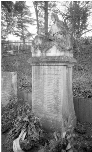
Bischberg, kommunales Kriegerdenkmal für die Gefallenen beider Weltkriege auf dem Friedhof (Aufnahme Israel Schwierz, 1996). Copyright BayHStA, BS N 80 80/76-22A

In Bischberg findet man ein Kriegerdenkmal für die Gefallenen beider Weltkriege auf dem Friedhof neben der Kirche.