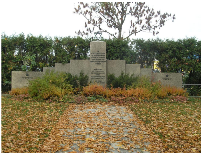
Gedenkstätte auf dem jüdischen Friedhof in Hof über einem Massengrab von 142 ermordeten jüdischen KZ-Häftlingen (Aufnahme 2006).

Der jüdische Friedhof liegt am westlichen Stadtrand rechts der Bundesstraße B15 in Richtung Autobahn A9 (Autobahnauffahrt Hof West, Richtung Leupoldgrün). Er hat eine Größe von etwa 2700 qm und wurde 1911 eingeweiht.