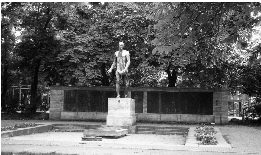
Hof, Kriegerdenkmal für die Gefallenen beider Weltkriege.

Das Kriegerdenkmal für die Gefallenen der beiden Weltkriege ist in Hof im Wittelsbacher Park, unweit des Hauptbahnhofes und der Stadtbücherei zu finden. An einer großen Mauer, vor der eine Metallstatue steht, sind elf gleich große Gedenktafeln angebracht. Auf der mittleren Tafel ist die folgende Inschrift zu lesen: HELDEN DER STADT RUHENDE SAAT MAHNEN ZUR ERNTE KÜNFTIGER TAT. Rechts und links davon befinden sich jeweils fünf Tafeln, auf denen – geordnet nach Kriegsjahren – die Namen der Gefallenen alphabetisch verewigt worden sind. Unter den Kriegstoten ist auf der linken Seite unter der Jahreszahl 1915 der Name des jüdischen deutschen Soldaten