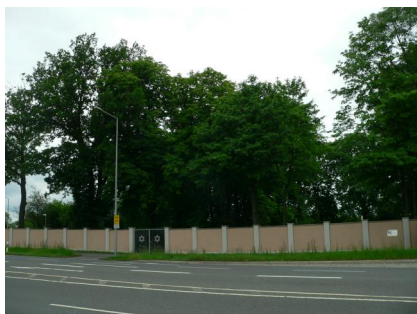
Friedhof der Israelitischen Kultusgemeinde, an der Stadtgrenze gelegen, umfriedete Parkanlage mit Grabsteinen, angelegt 1911.