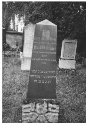
Jüdischer Friedhof Neumarkt/Oberpfalz.