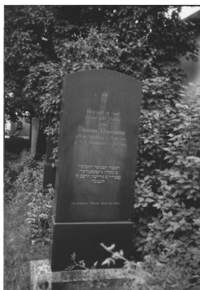
Jüdischer Friedhof Neumarkt/Oberpfalz.