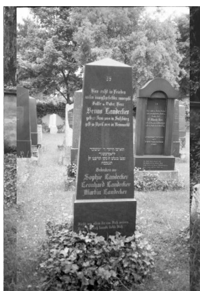
Jüdischer Friedhof Neumarkt/Oberpfalz.