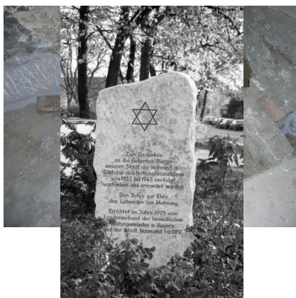
Neumarkt in der Oberpfalz, Mahnmal für die Opfer der Shoah (Aufnahme Israel Schwierz, 1996). Copyright BayHStA, BS N 80 80/58-04A

Mikwe aus der zweiten Hälfte des 15. Jahrhunderts im "Schreiber-Haus" in der Bräugasse 19. Das ursprünglich um 1430 erbaute Haus wurde zu dieser Zeit umgebaut. Die Mikwe wurde spätestens 1610 zugeschüttet (Aufnahme 2005)