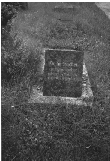
Jüdischer Friedhof Neumarkt/Oberpfalz.

Der jüdische Friedhof in der Stadt Neumarkt liegt an der Gießereistraße. Er hat eine Fläche von fast 1000 qm und wurde 1879/1880 eingerichtet.