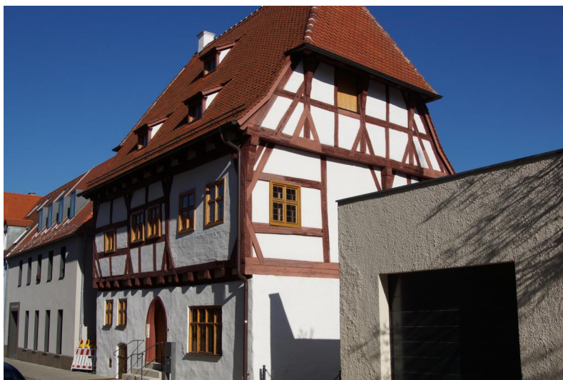
Ehemaliges Wohnhaus, sog. Schreiberhaus, Bräugasse 19, zweigeschossiger Halbwalmdachbau mit Fachwerkobergeschoss, 1430, mit Umbau 1610; Mikwe, jüdisches Ritualbad, um 1450.

In Neumarkt lässt sich eine über 500jährige Geschichte jüdischen Lebens nachweisen. Die erste Nennung von hier ansässigen Israeliten erfolgte im Zusammenhang mit dem Rintfleischpogrom 1298: Über 66 Juden wurden während dieser grausamen Exzesse ermordet. In Nürnberg sind für die Jahre 1314, 1326 und 1349 Juden bezeugt, die aus Neumarkt stammten. In den Pestpogromen 1348/49 wurde die Gemeinde von Neumarkt erneut das Opfer eines Pogroms. Ihre Synagoge fiel anschließend an Kurfürst Ruprecht I. von der Pfalz (reg. 1329-1390), der das Gotteshaus jedoch 1362 zurückgab. Schriftliche Quellen bezeugen für die Jahre 1362 bis 1391 fünf jüdische Hausväter, die dann im Zuge einer allgemeinen Ausweisung den Ort wieder verlassen mussten.