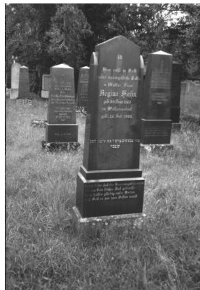
Jüdischer Friedhof Neumarkt/Oberpfalz.