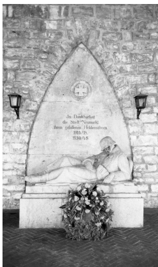
Neumarkt in der Oberpfalz, Kriegerdenkmal für die Gefallenen beider Weltkriege.

Das Kriegerdenkmal für die Gefallenen beider Weltkriege befindet sich in unmittelbarer Nähe des städtischen Friedhofes zwischen Ingolstädter und Regensburger Straße. Eine eigene Gedenktafel hing einst in der Synagoge, wurde jedoch zerstört; auf dem jüdischen Friedhof erinnern noch zwei Grabsteine an Kriegsteilnehmer.