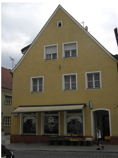
Gebäude am Standort der ehemaligen Synagoge.

Die Quellen berichten bereits Mitte des 14. Jahrhundert von einer Synagoge in Neumarkt. Näheres über den Standort dieses Gotteshauses ist nicht bekannt. Als sich in den 1860er Jahren wieder Juden in Neumarkt ansiedelten, trafen sie sich anfangs in Privathäusern zum Gottesdienst. 1868 erwarben Salomon Oettinger und Joseph Goldschmidt von dem Büchsenmacher Johann Gloßner ein großes Anwesen mit Wohnhaus, Waschküche, Hofraum und Brunnen in der Hafnergasse 10 (heute: Hallertorstr. 9a), das bis zum Sommer um- und ausgebaut wurde. Bei seiner Fertigstellung verfügte es über einen großen, zweigeschossigen Betsaal, der die gesamte Hausbreite einnahm, eine Wohnung für den Vorbeter, eine Mikwe sowie weitere Räume, in die 1872 die israelitische Elementarschule einzog.