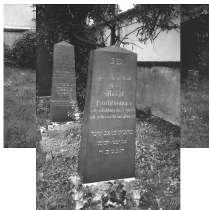
Jüdischer Friedhof Neumarkt/Oberpfalz.