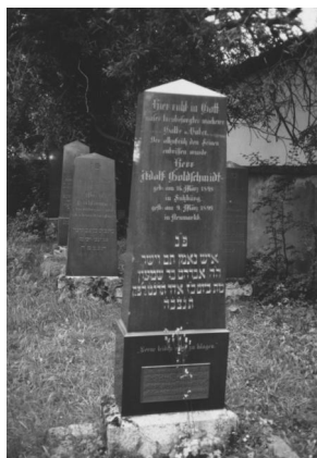
Jüdischer Friedhof Neumarkt/Oberpfalz.