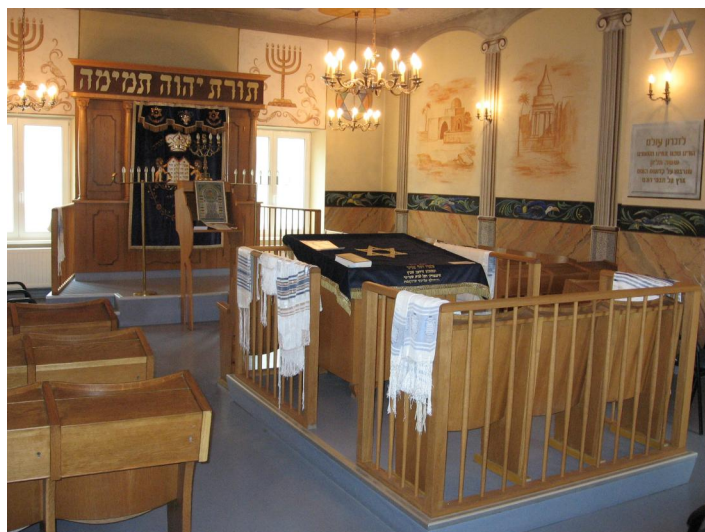
Blick in den Betsaal, 2006.