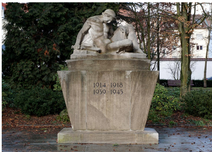
Weiden, neu gestaltetes Kriegerdenkmal am Konrad-Adenauer-Platz (Aufnahme 2020).