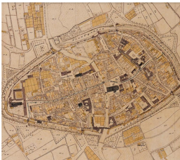
Amberg, Uraufnahme 1808-1864 (Ausschnitt).

In Amberg, das im mittelalterlichen Fernhandel eine bedeutende Rolle spielte, hielten sich vermutlich schon im 11. Jahrhundert Juden auf. Als Herzog Rudolf I. von Bayern (reg. 1294-1317) dem Ort 1294 die Stadtrechte bestätigte, ordnete er im 18. Artikel dieses Dokuments die steuerliche Gleichbehandlung von Juden und Christen an und erwähnte damit erstmals ihre Existenz in der Stadt. Die jüdischen Bewohner hatten an den Herzog Schutzgelder zu bezahlen. Trotzdem wurden viele von ihnen ein Opfer des Rintfleischpogroms 1298, laut den Aufzeichnungen des Nürnberger Memorbuches wurden damals in Amberg 13 Männer, Frauen und Kinder getötet.