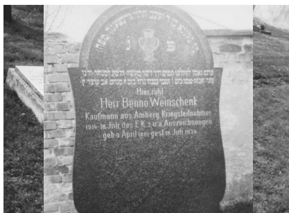
Jüdischer Friedhof Amberg.