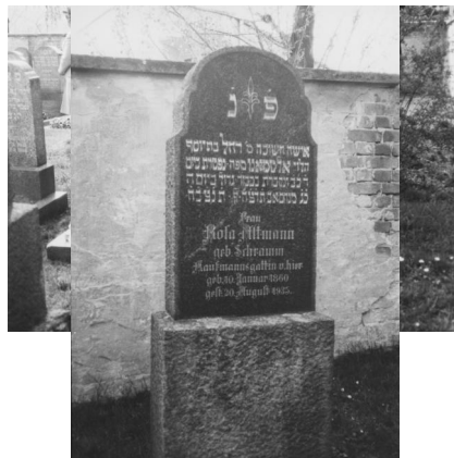
Jüdischer Friedhof Amberg.