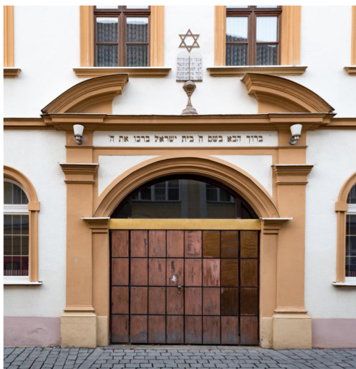
Amberg, Salzgasse 5, Portal der ehem. Synagoge (Aufnahme 2017).