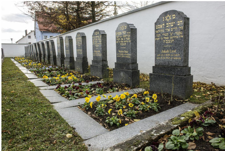
Auf dem Jüdischen Friedhof in Amberg sind 38 ehemalige KZ-Häftlinge beerdigt.

Der Friedhof liegt am südöstlichen Stadtrand von Amberg. Die Einweihung erfolgte 1927. Er wird bis heute von der in Amberg bestehenden jüdischen Gemeinde belegt.