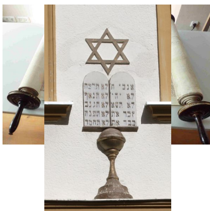
Die Synagoge der Israelitischen Kultusgemeinde Amberg, 2019.