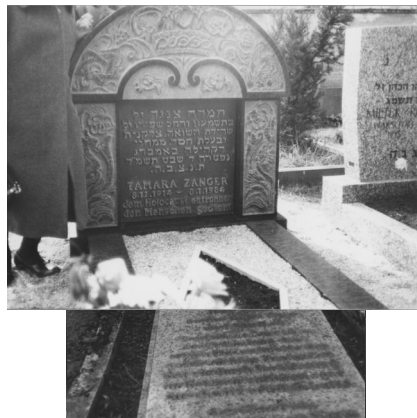
Jüdischer Friedhof Amberg.