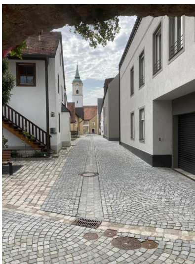
Abensberg, ehemalige "Judengasse", heute Mahlergasse (Aufnahme 2023).

In Abensberg bestand ab 1348 eine jüdische Gemeinde. Im März 1366 bestätigte der reichsunmittelbare Ortsherr Ulrich III. von Abensberg (1322-1366) kurz vor seinem Tod noch einmal allen Bürgern, seien es nun Christen oder Juden, bei der Beschickung seines Marktes ungehinderten Zugang. Erstmals werden 1391 und 1398 Juden in der Stadt urkundlich erwähnt. Weitere Nennungen gibt es im 15. Jahrhundert. Ehemals in Abensberg lebende Juden ("von Abensberg") erscheinen 1450 in Plattling und 1411 sowie 1465-75 in Regensburg . Die jüdischen Familien in Abensberg lebten vor allem vom Geldhandel und der Pfandleihe.