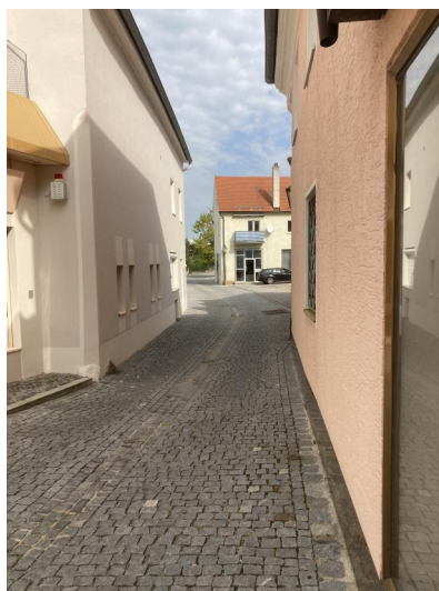
Blick in die Schmidtgasse, in der der Standort der einstige Synagoge vermutet wird

In seiner Bairischen Chronik, die der gebürtige Abensberger Johannes Aventinus (1477-1534) in den 1520ern verfasste, beschrieb er die Situation in seinem Heimatort: "Es haist noch die Judengassen, der Judenprunnen, der Judenpühel (ir grebnus) alda, und die sinagog ist ietzo das schergenhaus der stat". Die jüdischen Familien hatten ihre Wohnungen im Bereich einer Judengasse (heutigen Mahlergasse), in der parallel dazu verlaufenden Schmidtgasse befand sich die genannte Synagoge, die zum "Schergenhaus" (Plan-Nr. 201, heute Schmidtgasse 10?) umgebaut und als Gefängnis genutzt wurde. Erst zwischen 1946 und 1950, nach vielen Umbauten und Umnutzungen, wurde sie endgültig abgerissen.