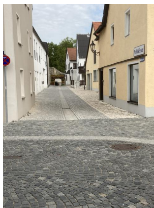
Die ehemalige "Judengasse", heute Mahlergasse von der Innenstadt zur Stadtmauer