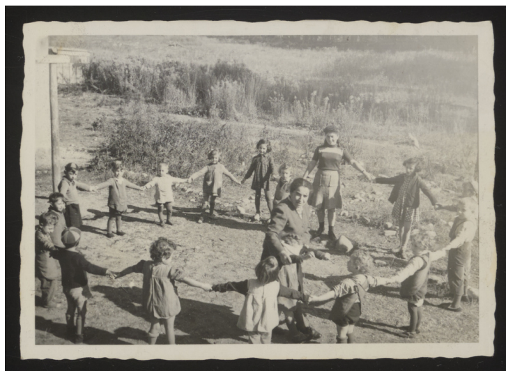
Spielende Kinder im jüdischen DP-Kindergarten Feldafing (Oktober 1947). HMM, 1996.A.0581.1_006_005_0008-S.

In Feldafing gab es bis nach dem Sturz der NS-Diktatur keine jüdischen Einwohner. Unmittelbar nach Kriegsende errichtete die amerikanische Militärverwaltung – gemeinsam mit der UNRRA – das größte Lager für jüdische "Displaced Persons" (DPs) in der US-Besatzungszone. Auf dem Gelände der ehemaligen NSDAP-Reichsschule, einigen Villen der näheren Umgebung und den Baracken eines HJ-Sommerlagers lebten vom Mai 1945 bis März 1953 bis zu 5000 Jüdinnen und Juden, die zum Großteil aus den befreiten Lagern im Osten stammten. Bereits im November 1945 lebten 3.500 Jüdinnen und Juden jeden Alters im DP-Lager Feldafing. Innerhalb eines halben Jahres kamen nochmals 700 DPs hinzu. Erst nach der Staatsgründung Israels im Mai 1948 sank die Zahl auf 2.887 im Oktober 1948, bis das Lager im März 1953 geschlossen wurde.