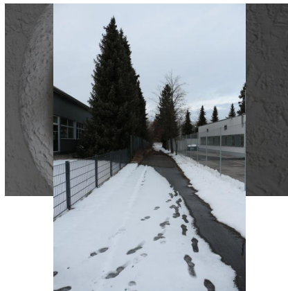
KZ-Friedhof und Gedenkstätte Landsberg a. Lech.