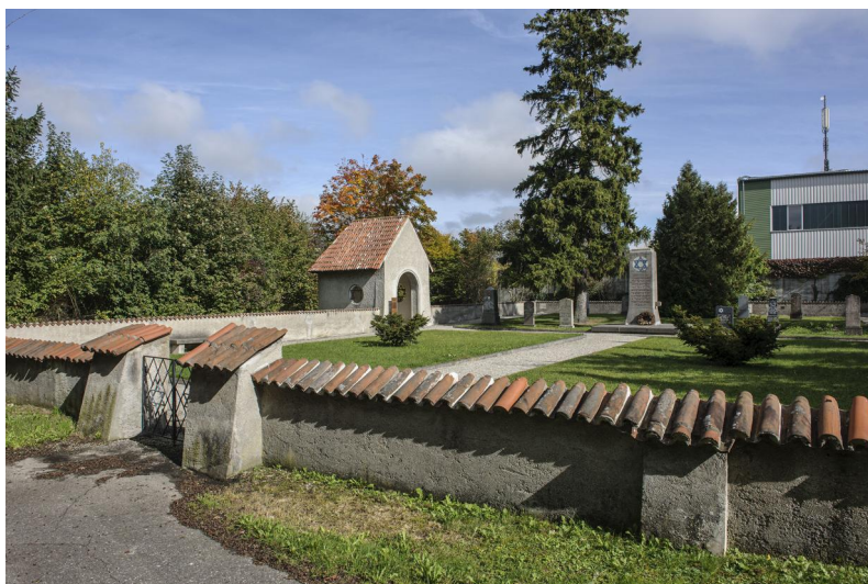
KZ-Friedhof und Gedenkstätte Landsberg a. Lech

Der Friedhof mit der Gedenkstätte liegt am Stadtrand im Gewerbegebiet. Er entstand im Zusammenhang mit dem Lager I des KZ-Außenlagerkomplexes Landsberg/Kaufering, dessen Kommandantur sich circa 600 m Luftlinie entfernt im heutigen Industriegebiet befunden hat. Von Juni bis Dezember 1944 starben im Lager 1658 Zwangsarbeiter. Die Toten aus dem gesamten Komplex wurden zunächst über das Lager I einmal wöchentlich nach Dachau gefahren, ab einem nicht näher bestimmbareren Zeitpunkt bis zum 28. April 1945 begrub man sie am Lager I und (unter peinlicher Geheimhaltung) an verschiedenen anderen nahe gelegenen Orten. Rund 200 m vom ausgestalteten Friedhof entfernt befand sich von 1953 bis 1961 zusätzlich das "KZ-Einzelgrab Iglinger Straße Süd", ein Betonrondell mit Gedenkstein.