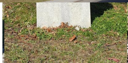
Landsberg am Lech, Gedenktafel in einer neuen Fassung von 2018, an der Irving-Heymont-Straße vor dem ehem. Verwaltungsgebäude der Saarburgkaserne (Aufnahme 2023).