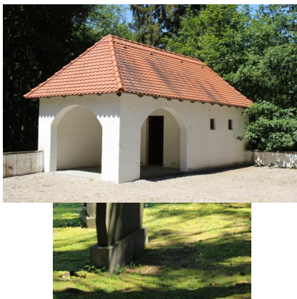
KZ-Friedhof und Gedenkstätte Erpfting, 2016.

Links des Steins befinden sich an der linken Mauer neun Gräber; das Gelände rechts des Gedenksteines jenseits der Umfassungsmauer ist ebenfalls von einer niedrigen Umfassungsmauer umgeben, auch hier ziert ein Davidstern das schmiedeeiserne Türchen.