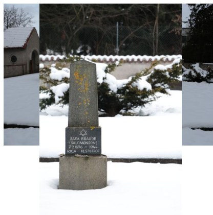
KZ-Friedhof und Gedenkstätte Landsberg a. Lech.