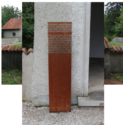
KZ-Friedhof und Gedenkstätte Landsberg/L.