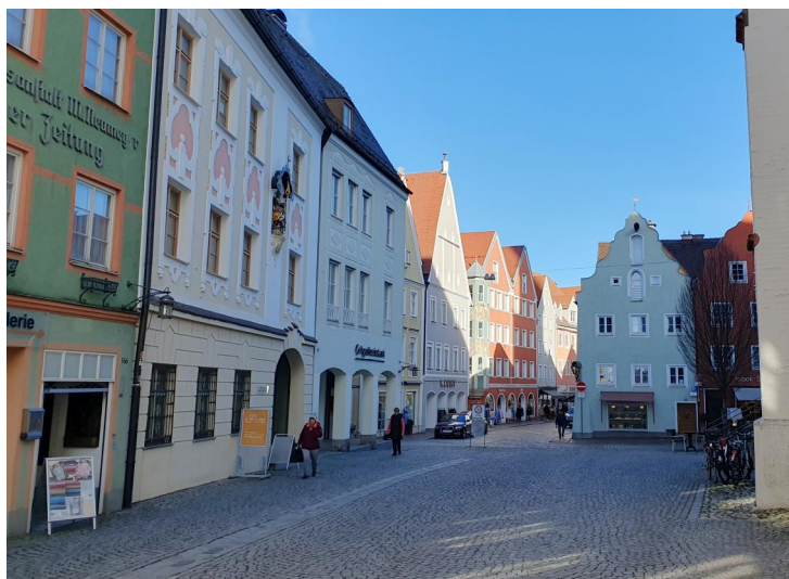
Landsberg am Lech, Blick von der Stadtpfarrkirche Mariä Himmelfahrt in die frühere Judengasse, jetzt Ludwigstraße. Links unter der Hausmadonna befindet sich der Eingang zum Pfarrzentrum, wo der Synagogenstandort vermutet wird (Aufnahme 2023).

Im Jahr 1158 errichtete der Welfenherzog Heinrich der Löwe eine Brücke an der Lech und gründete (parallel zu München) an der alten Burg Phetine ein neues Handelszentrum: Landsberg. Ungewiss bleibt, wann dem Ort das Stadtrecht mit Privilegien wie etwa dem Judenschutz gewährt wurde. Das erste Mal ist im sogenannten Zweiten Herzogsurbar Ludwigs des Strengen 1279/1284 von einem Stadtgericht (de iudico civitatis) die Rede, der Aufstieg Landsbergs muss also in den ersten hundert Jahren seiner Geschichte erfolgt sein. Hierfür spricht auch, dass im späten 13. Jahrhundert die erste, mit der erhöht gelegenen Burg verbundene Stadtbefestigung errichtet wurde.