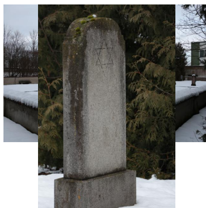
KZ-Friedhof und Gedenkstätte Landsberg a. Lech.