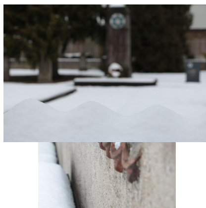
KZ-Friedhof und Gedenkstätte Landsberg a. Lech.