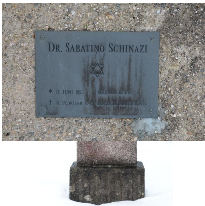
KZ-Friedhof und Gedenkstätte Landsberg a. Lech.