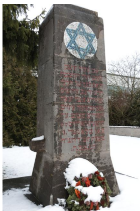
KZ-Friedhof und Gedenkstätte Landsberg a. Lech.