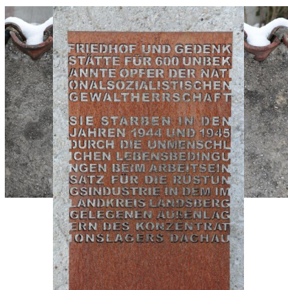
KZ-Friedhof und Gedenkstätte Landsberg a. Lech.