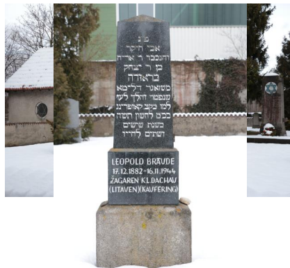
KZ-Friedhof und Gedenkstätte Landsberg a. Lech.