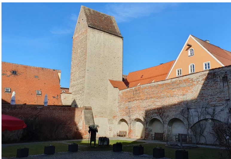
Landsberg am Lech, Hof vor dem kath. Pfarrzentrum, wo der Synagogenstandort vermutet wird. Links erhebt sich der sog. Hexenturm (Fronfesturm) und Reste der Stadtmauer aus dem 13. Jahrhundert (Aufnahme 2023).