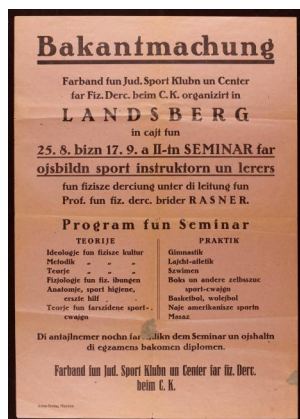
Bekantmachung des jüdischen Sportclubs für ein Seminar im DP-Lager Landsberg, um 1947. JMB, 2012/352/0.