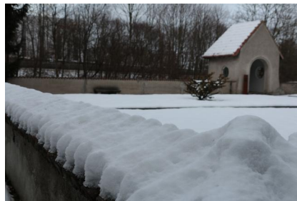
KZ-Friedhof und Gedenkstätte Landsberg a. Lech.