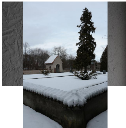
KZ-Friedhof und Gedenkstätte Landsberg a. Lech.