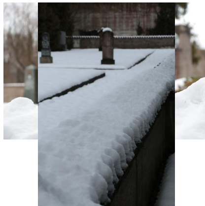
KZ-Friedhof und Gedenkstätte Landsberg a. Lech.