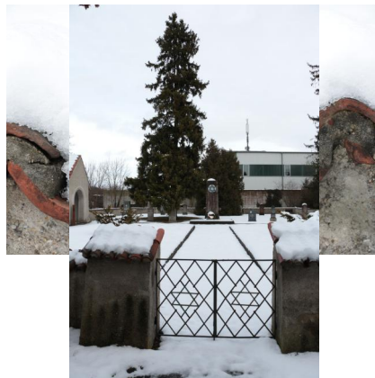
KZ-Friedhof und Gedenkstätte Landsberg a. Lech.