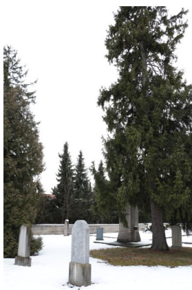
KZ-Friedhof und Gedenkstätte Landsberg a. Lech.