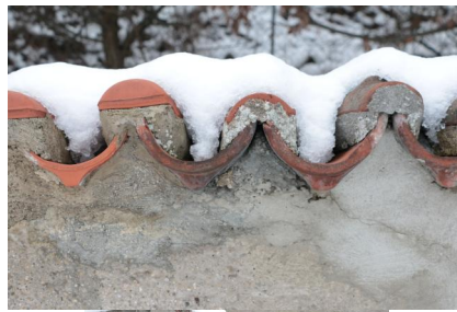
KZ-Friedhof und Gedenkstätte Landsberg a. Lech.