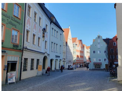
Landsberg am Lech, Blick von der Stadtpfarrkirche Mariä Himmelfahrt in die frühere Judengasse, jetzt Ludwigstraße. Links unter der Hausmadonna befindet sich der Eingang zum Pfarrzentrum, wo der Synagogenstandort vermutet wird (Aufnahme 2023).

In der lokalen Überlieferung wird der große Innenhof des Anwesens Nr. 167 mit einer mittelalterlichen Synagoge in Verbindung gebracht. Der Innenhof lag einst zentral an der "Judengasse", der heutigen Ludwigstraße, gegenüber der Stadtpfarrkirche Mariä Himmelfahrt. Heute befindet sich dort das katholische Pfarrzentrum. Wenn denn die Vermutung zutrifft, dass der kleine Bereich zwischen Ludwigstraße, Vorderer Mühlgasse und Salzgasse im 13. Jahrhundert ein jüdisches Viertel gebildet hat, dann entsprach dieser Standort parallel zur Häuserzeile an der Straße den rituellen Erfordernissen. Andererseits fehlen bislang eindeutige archäologische oder archivalische Belege, sodass auch hier wieder ein großes "vielleicht" stehen muss.