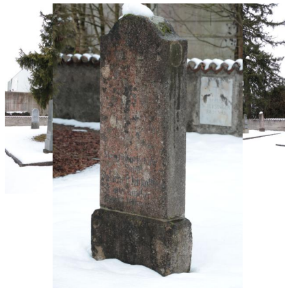
KZ-Friedhof und Gedenkstätte Landsberg a. Lech.