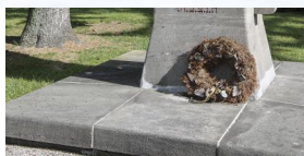
KZ-Friedhof und Gedenkstätte Landsberg a. Lech