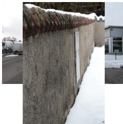
KZ-Friedhof und Gedenkstätte Landsberg a. Lech.