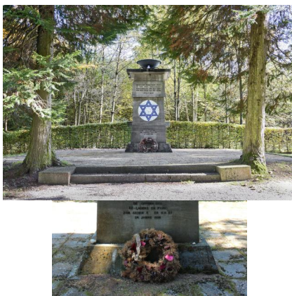
KZ-Friedhof und Gedenkstätte Erpfting, 2016.