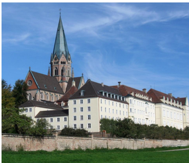
Erzabtei Sankt Ottilien bei Eresing, von 1945 bis 1948 DP-Sanatorium (Aufnahme 2010)