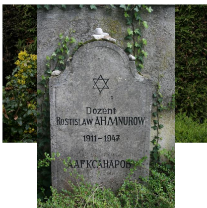
KZ-Friedhof und Gedenkstätte St. Ottilien.