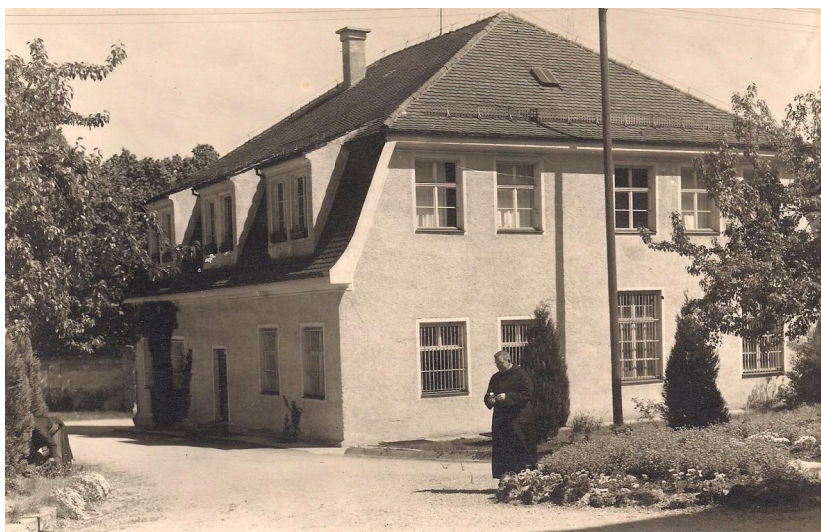
Ehem. Prokura, DP-Betraum und Bibliothek 1945-1948 (Haus St. Paulus), Aufnahme um 1930.

Das DP-Sanatorium bzw. die dort lebende jüdische DP-Gemeinde verfügte im Klostergebäude von Sankt Ottilien über einen Betsaal, der sich im ersten Obergeschoss des Hauses St. Paulus befand. Das Gebäude war ursprünglich ein Pförtnerhäuschen und diente später jahrelang als Prokura. In der DP-Zeit lagerten in den Speicherräumen und im Packraum Kleider und Proviant. Ein Teil der oberen Büroräume wurde in eine Schneiderwerkstatt umgewandelt. Daneben entstand eine jüdische Betstube mit Bibliothek, in der sich täglich 10 bis 20 Betende einfanden. Als Kopfbedeckungen verwendeten sie oft noch ihre KZ-Mützen, und als Gebetsschals dienten weiße Laken. Die Mönche konnten sich aus ihren Räumen im Klostergebäude mit der jüdischen Form des Gottesdienstes auseinandersetzen. Das Gebäude wurde 2018 abgerissen.