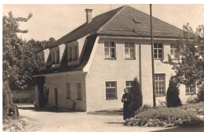
Ansicht des Hauses St. Paulus vom Westen aus, DP-