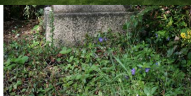
KZ-Friedhof und Gedenkstätte St. Ottilien.