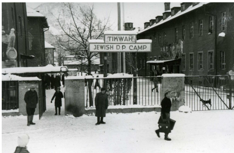
Bad Reichenhall, Nonner Straße, Haupteingang des DP-Lagers "Tikwa" (Aufnahme wohl Winter 1947).

Nach dem Sturz des NS-Regimes 1945 wurde Bad Reichenhall eine Heimat auf Zeit für tausende jüdische Displaced Persons, die zumeist aus Osteuropa stammten und nach der Befreiung der Arbeits- und Vernichtungslager im Land der Täter strandeten. Die US-Amerikanische Besatzungsmacht richtete zusammen mit der UNRRA ein großes DP-Lager in der Hohenstaufen-Kaserne ein; zusätzlich wurde Wohnraum im Stadtgebiet für eine DP-Gemeinde beschlagnahmt. In Bad Reichenhall fand am 25.-27. Februar 1947 der zweite und vom 30. März bis 1. April 1948 dritte Kongress der Befreiten Juden in der Amerikanischen Besatzungszone statt, auf denen politische, kulturelle und soziale Fragen besprochen wurden. DP-Lager und -Gemeinde bestanden bis 1949 bzw. 1951.