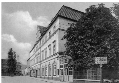
Altötting, Neuöttinger Straße 5, ehem. Gasthof Lechner, in dem von 1946 bis 1951 u.a. ein DP-Betsaal untergebracht war (Aufnahme 1938).

Die jüdische DP-Gemeinde Altötting hatte von 1946 bis 1951 im beschlagnahmten "Gasthaus Bayerischer Hof" (Neuöttinger Straße 5) nahe dem Kapellenplatz ihren Verwaltungssitz und ihr soziales Zentrum. Im großen Gebäude befand sich auch ein mehr oder minder provisorischer Betsaal. Seine genaue Lage ist jedoch unbekannt, auch gibt es keine Details über die Ausstattung. Im Mai 1947 wandte sich die jüdische DP-Gemeinde an die Stadt und das Wirtschaftsamt mit der Bitte, ihr Holz, Samt und Seide für einen Betraum zur Verfügung zu stellen. Der Gasthof wurde inzwischen grundlegend umgebaut und beherbergt heute eine Filiale der Deutschen Angestellten-Akademie (DAA).