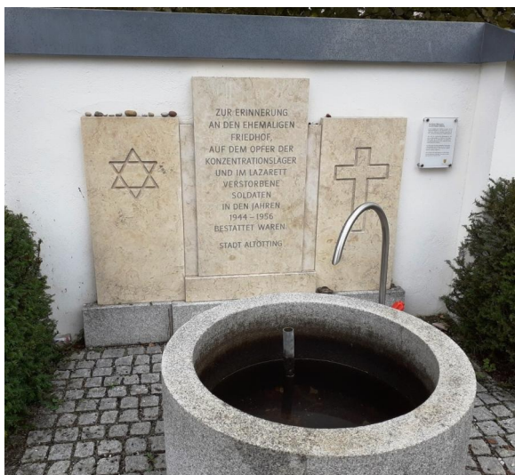
Neugestaltete Gedenkstätte für den aufgelösten Soldaten- und KZ-Friedhof (Aufnahme 2014).

Neben dem städtischen Friedhof von Altötting wurden von Juni bis August 1945 etwa 250 Häftlinge beigesetzt, die in der Mettenheimer Außenstelle des KZ Dachau durch die katastrophalen Lebens- und Arbeitsbedingungen umgekommen sind und deren Leichname auf Befehl der Militärregierung von einem Massengrab im Mühldorfer Hart zunächst nach Altötting gebracht wurden. Im Laufe des Jahres 1956 wurden die sterblichen Überreste der KZ-Opfer auf den KZ-Friedhof und Ehrenfriedhof Dachau überführt. Die Grablage in Altötting wurde aufgelöst, ein bis dahin hier stehendes Denkmal abgebaut, verkauft und weiter verarbeitet. Erst im Jahr 2014 wurde ein neues Denkmal aufgestellt, das an die Umgekommenen des Konzentrationslagers wie auch an über 250 Soldaten erinnert, die in den Lazaretten in Altötting ab 1944 bestattet wurden. Letztere hatte man im September 1953 nach Schönau bei Berchtesgaden oder in ihre Heimat gebracht beziehungsweise umgebettet. Das 2014 aufgestellte Denkmal besteht aus drei Platten und befindet sich am Durchgang vom städtischen Friedhof auf das Nachbargelände, wo einst die Grabstellen der Soldaten und der KZ-Opfer waren und trägt die Inschrift: "Zur Erinnerung an den ehemaligen Friedhof, auf dem Opfer der Konzentrationslager und im – Lazarett verstorbene Soldaten in den Jahren 1944 bis 1956 bestattet waren".