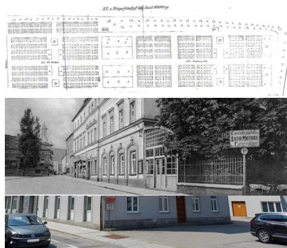
Altötting, Neutöttinger Straße 5, ehem. Gasthaus Lechner (Bayerischer Hof), 1945-1951 DP-Unterkunft mit Betsaal (Aufnahme 2025).