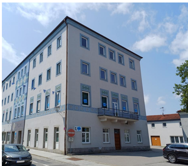
Altötting, Neuöttinger Straße 5, ehem. Gasthaus Lechner (Bayerischer Hof), 1945-1951 DP-Unterkunft mit Betsaal (Aufnahme 2025).

Die jüdische DP-Gemeinde Altötting hatte von 1946 bis 1951 im beschlagnahmten "Gasthaus Bayerischer Hof" (Neuöttinger Straße 5) nahe dem Kapellenplatz ihren Verwaltungssitz und ihr soziales Zentrum. Im großen Gebäude befand sich auch ein mehr oder minder provisorischer Betsaal. Seine genaue Lage ist jedoch unbekannt, auch gibt es keine Details über die Ausstattung. Im Mai 1947 wandte sich die jüdische DP-Gemeinde an die Stadt und das Wirtschaftsamt mit der Bitte, ihr Holz, Samt und Seide für einen Betraum zur Verfügung zu stellen. Der Gasthof wurde inzwischen grundlegend umgebaut und beherbergt heute eine Filiale der Deutschen Angestellten-Akademie (DAA).