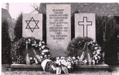
Denkmal auf dem ehemaligen Soldaten- und KZ-Friedhof in Altötting (Aufnahme 1950). Copyright Sammlung Christian Haringer, Altötting

Neben dem städtischen Friedhof von Altötting wurden von Juni bis August 1945 etwa 250 Häftlinge beigesetzt, die in der Mettenheimer Außenstelle des KZ Dachau durch die katastrophalen Lebens- und Arbeitsbedingungen umgekommen sind und deren Leichname auf Befehl der Militärregierung von einem Massengrab im Mühldorfer Hart zunächst nach Altötting gebracht wurden. Im Laufe des Jahres 1956 wurden die sterblichen Überreste der KZ-Opfer auf den KZ-Friedhof und Ehrenfriedhof Dachau überführt. Die Grablage in Altötting wurde aufgelöst, ein bis dahin hier stehendes Denkmal abgebaut, verkauft und weiter verarbeitet. Erst im Jahr 2014 wurde ein neues Denkmal aufgestellt, das an die Umgekommenen des Konzentrationslagers wie auch an über 250 Soldaten erinnert, die in den Lazaretten in Altötting ab 1944 bestattet wurden. Letztere hatte man im September 1953 nach Schönau bei Berchtesgaden oder in ihre Heimat gebracht beziehungsweise umgebettet. Das 2014 aufgestellte Denkmal besteht aus drei Platten und befindet sich am Durchgang vom städtischen Friedhof auf das Nachbargelände, wo einst die Grabstellen der Soldaten und der KZ-Opfer waren und trägt die Inschrift: "Zur Erinnerung an den ehemaligen Friedhof, auf dem Opfer der Konzentrationslager und im – Lazarett verstorbene Soldaten in den Jahren 1944 bis 1956 bestattet waren".