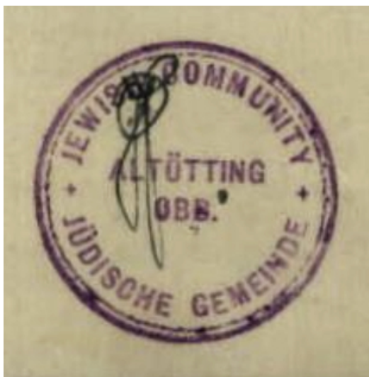
Siegelstempel der jüdischen DP-Gemeinde Altötting. Detail aus: Monatsbericht betr. jüdischer DPs, die am 25. September 1947 im Lager Altötting II – Gasthaus "Bayerischer Hof" gemeldet waren/8803970/ITS Digital Archive, Arolsen Archives.

Im Wallfahrtsort der Schwarzen Madonna, dem Herzen altbayerischer Frömmigkeit, gab es – nach derzeitigem Kenntnisstand – zu keiner Zeit ein jüdisches Gemeindeleben. Nach 1861 bis Mitte der 1930er Jahre lebten nur vereinzelt jüdische Personen im Ort. Im Jahr 1946 richteten die US-Militärverwaltung und die UNRRA eine Auffangstation für jüdische Displaced Persons (DPs) aus den befreiten Lagern in Osteuropa ein. Dafür wurde privater Wohnraum sowie das Gasthaus "Bayerischer Hof" (Neuöttinger Straße 5) requiriert. Dort befanden sich das Gemeindezentrum sowie ein Betsaal. Zwischen 1945 und 1956 wurden 250 Todesopfer aus dem KZ-Außenlager Mettenheim in Altötting beigesetzt und später auf den KZ-Friedhof und Ehrenfriedhof Dachau überführt.