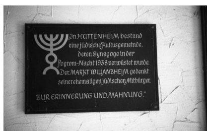
Hüttenheim, Gedenktafel an die ehem. Kultusgemeinde Hüttenheim (Aufnahme Israel Schwier, 1996). Copyright BayHStA, BS N 80 80/109-21

Nach 1945 zogen zunächst Heimatvertriebene in das Synagogengebäude, das sich heute in Privatbesitz befindet. Der Familie Kalbhenn-Link gehört auch das benachbarte "Vorsängerhaus" mit Mikwe. Für die sorgfältige Restaurierung der ehemaligen Synagoge wurden die Eigentümer 2009 mit der bayerischen Denkmalschutzmedaille ausgezeichnet. Eine Hinweistafel verweist auf die Geschichte des Gebäudeensembles.