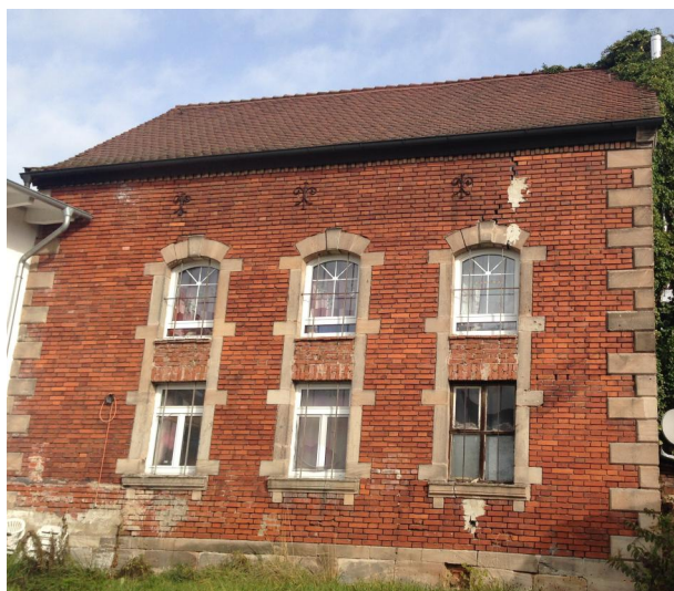
Wilhermsdorf, Hauptstraße 3, ehem. Synagoge von Süden.

Die erste gesicherte Synagoge in Wilhermsdorf wurde 1735/36 erbaut, das Datum stand auf dem später wiederverwendeten Chuppastein. Nach lokaler Überlieferung habe der Gottesdienst zuvor in Privatwohnungen stattgefunden. Die Mitglieder der jüdischen Gemeinde in Markt Erlbach besuchten bis zum 18. Jahrhundert die Synagoge in Wilhermsdorf, dann errichteten sie ein eigenes Gotteshaus. Ein Abriss des bestehenden Gebäudes und ein Neubau der Synagoge wurde Ende des 19. Jahrhunderts in Auge gefasst. 1893 lagen die ersten Pläne für eine Bebauung eines neuen Grundstücks vor (Hauptstraße 3).