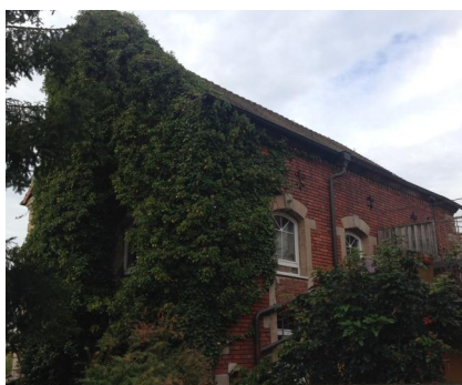
Ansicht der Synagoge Wilhermsdorf von Nordosten.