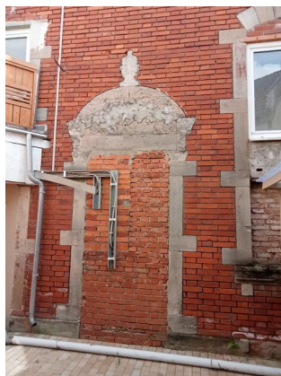
Wilhermsdorf, Hauptstraße 3, ehem. Synagoge - Westseite mit vermauertem Eingang zur Männerabteilung (Aufnahme 2023).