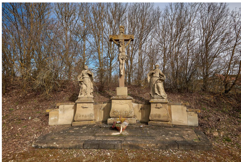
Bastheim, Kreuzigungsgruppe mit Gedenktafeln (Aufnahme 2021).

Das Kriegerdenkmal für die Gefallenen beider Weltkriege aus Bastheim – eine Kreuzigungsgruppe mit Tafeln unter den drei Figuren und weiteren Tafeln daneben – befindet sich in der Ortsmitte, rechts der Hauptstraße in Richtung Oberelsbach am Spielberg.