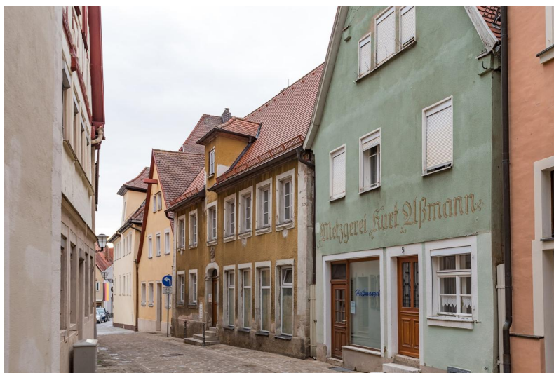
Weißenburg in Bayern, Blick in die Judengasse mit ehem. jüdischen Badehaus im gelb gestrichenen Anwesen Judengasse 3 (Aufnahme 2018).

Eine erste Anfrage der Stadt Weißenburg 1288 an die Stadt Nürnberg um Übermittlung des dortigen Judenpfandrechts ist der erste Hinweis auf eine jüdische Gemeinschaft. Sie zahlte neben der Juden- und Kopfsteuer auch ein Schutzgeld an die Stadtverwaltung, die in Repräsentanz des Reiches das Geld einzog und dem Kaiser seinen Anteil zustellte. Die Anwesenheit jüdischer Geschäftsleute ist ein Indikator für die Prosperität der aufstrebenden Stadt, die sich auch in der Verleihung wichtiger städtischer Privilegien und dem Bau der repräsentativen Pfarrkirche St. Andreas 1290-1327 äußerte. Das jüdische Leben konzentrierte sich zunächst auf die Paradeisgasse im Norden der Stadt, wo nahe dem Ellinger Tor auch die Synagoge stand. Eine Mikwe wird am Standort der später errichteten Schranne (Ecke Judengasse / An der Schranne) vermutet. In einem ehemaligen Bürgermeisterhaus wurde der Grabstein einer Frau namens Nechel ba Elija gefunden. Er trägt das hebräische Datum vom 19. November 1290 und verdeckte einen Mauerhohlraum mit verbrannten menschlichen Gebeinen. Der Fund gibt Rätsel auf, aber weist auf die Existenz eines abgegangenen jüdischen Friedhofs in Weißenburg hin.