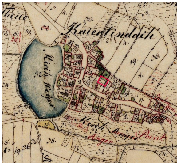
Kairlindach, Uraufnahme 1808-1864 (Ausschnitt). Das Synagogengebäude auf dem Anwesen Nr. 24 ist rot markiert.