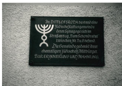
Eine Gedenktafel am Gemeindehaus erinnert an das Schicksal der jüdischen Mitbürger von Dittlofsroda (Aufnahme um 1990).