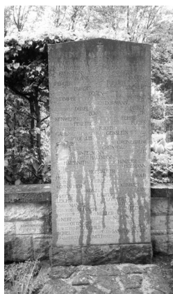
Bamberg, Gedenkstätte auf dem Ehrenfriedhof: 20 Steintafeln für die Gefallenen des Ersten Weltkriegs aus Bamberg, geordnet nach milit. Einheiten.

12A, 14A, 16A, 18A, 19A, 20A, 22A, 24A, 26A, 28A, 30A, 34A.