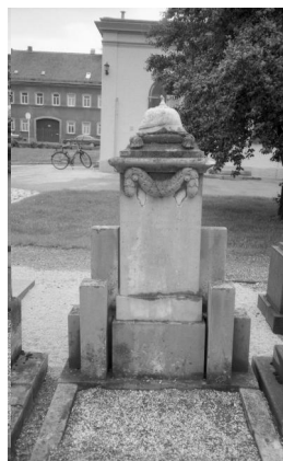
Bamberg, Grabmal von Gottfried Kronacher auf dem jüdischen Friedhof (Aufnahme Israel Schwier, 1996). Copyright BayHStA, BS N 80 80/46-15A