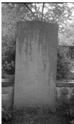
Bamberg, Gedenkstätte auf dem Ehrenfriedhof: 20 Steintafeln für die Gefallenen des Ersten Weltkriegs aus Bamberg, geordnet nach milit. Einheiten.