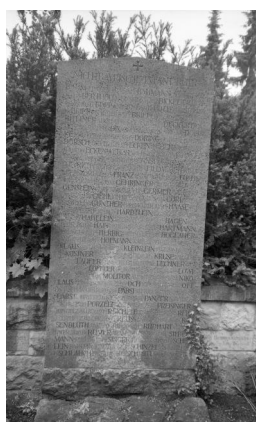
Bamberg, Gedenkstätte auf dem Ehrenfriedhof: 20 Steintafeln für die Gefallenen des Ersten Weltkriegs aus Bamberg, geordnet nach milit. Einheiten (Aufnahmen Israel Schwierz, 1996).

Copyright BayHStA, BS N 80 80/49-06A, 08A, 10A, 12A, 14A, 16A, 18A, 19A, 20A, 22A, 24A, 26A, 28A, 30A, 34A.