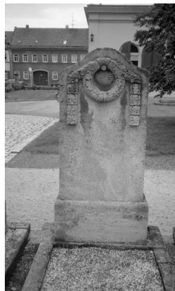
Bamberg, Grabstein von Josef Lederer auf dem jüdischen Friedhof (Aufnahme Israel Schwier, 1996). Copyright BayHStA, BS N 80 80/46-18A