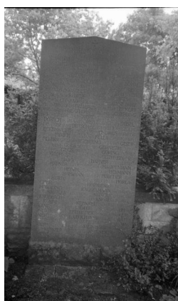
Bamberg, Gedenkstätte auf dem Ehrenfriedhof: 20 Steintafeln für die Gefallenen des Ersten Weltkriegs aus Bamberg, geordnet nach milit. Einheiten (Aufnahmen Israel Schwier, 1996). Copyright BayHStA, BS N 80 80/49-06A, 08A, 10A,

12A, 14A, 16A, 18A, 19A, 20A, 22A, 24A, 26A, 28A, 30A, 34A.