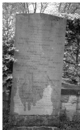
Bamberg, Gedenkstätte auf dem Ehrenfriedhof: 20 Steintafeln für die Gefallenen des Ersten Weltkriegs aus Bamberg, geordnet nach milit. Einheiten (Aufnahmen Israel Schwierz, 1996). Copyright BayHStA, BS N 80 80/49-06A, 08A, 10A,

12A, 14A, 16A, 18A, 19A, 20A, 22A, 24A, 26A, 28A, 30A, 34A.