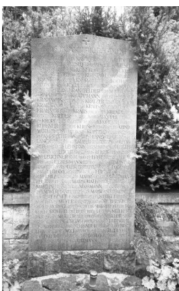
Bamberg, Gedenkstätte auf dem Ehrenfriedhof: 20 Steintafeln für die Gefallenen des Ersten Weltkriegs aus Bamberg, geordnet nach milit. Einheiten (Aufnahmen Israel Schwierz, 1996).

Copyright BayHStA, BS N 80 80/49-06A, 08A, 10A, 12A, 14A, 16A, 18A, 19A, 20A, 22A, 24A, 26A, 28A, 30A, 34A.