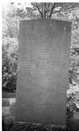
Bamberg, Gedenkstätte auf dem Ehrenfriedhof: 20 Steintafeln für die Gefallenen des Ersten Weltkriegs aus Bamberg, geordnet nach milit. Einheiten.