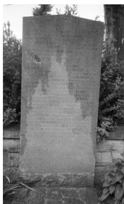
Bamberg, Gedenkstätte auf dem Ehrenfriedhof: 20 Steintafeln für die Gefallenen des Ersten Weltkriegs aus Bamberg, geordnet nach milit. Einheiten (Aufnahmen Israel Schwierz, 1996).

Copyright BayHStA, BS N 80 80/49-06A, 08A, 10A, 12A, 14A, 16A, 18A, 19A, 20A, 22A, 24A, 26A, 28A, 30A, 34A.