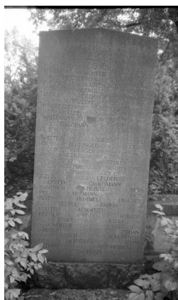
Bamberg, Gedenkstätte auf dem Ehrenfriedhof: 20 Steintafeln für die Gefallenen des Ersten Weltkriegs aus Bamberg, geordnet nach milit. Einheiten.

12A, 14A, 16A, 18A, 19A, 20A, 22A, 24A, 26A, 28A, 30A, 34A.