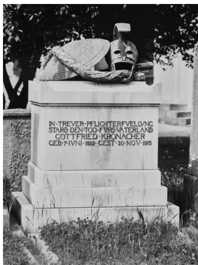
Grabstein auf dem Jüdischen Friedhof Bamberg, 2002. (BS 3643 - H003 B001)

Auf dem Hauptfriedhof ließ die Stadt Bamberg 1927 im Ehren- bzw. Helden-Friedhof zwanzig Steintafeln aufstellen, auf denen die Namen der Gefallenen aus Bamberg – geordnet nach militärischen Einheiten – eingraviert sind.