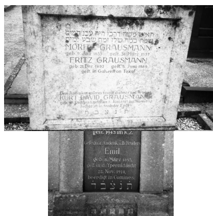
Bamberg, Grabmal von Emil Kohn auf dem jüdischen Friedhof (Aufnahme Israel Schwierz, 1996). Copyright BayHStA, BS N 80 80/45-01A

12A, 14A, 16A, 18A, 19A, 20A, 22A, 24A, 26A, 28A, 30A, 34A.