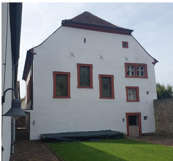
Veitshöchheim, Thüngersheimer Straße 19 - Rückgebäude, rekonstruierte Synagoge mit Mikwe, traditioneller Bima und Frauenempore (Aufnahme 2023).

Spätestens Ende des 17. Jahrhunderts konnte die Judenschaft in Veitshöchheim denn Minjan erfüllen und durfte gemeinsam die Gebete sprechen. Über eine Synagoge aus der damaligen Zeit ist jedoch nichts bekannt. Samuel Isak ließ sich im 2. Viertel des 18. Jahrhunderts am nördlichen Ortsausgang ein prächtiges Bürgerhaus (Haus Nr. 179, heute Thüngersheimer Straße 19) erbauen und veranlasste, dass zwischen 1727 und 1730 am anderen Ende seines großen, langgestreckten Grundstücks eine frei stehende Synagoge mit Mikwe errichtet wird (Haus Nr. 161 \frac{3}{4} , heute Mühlgasse 6). Diesen Sakralbau übergab er am 1. Februar 1730 der Kultusgemeinde zur Nutzung; sein Sohn Moses vererbte ihn 1746 endgültig der jüdischen Gemeinde.