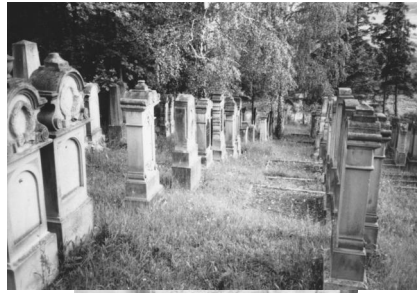
Jüdischer Friedhof Unleben.