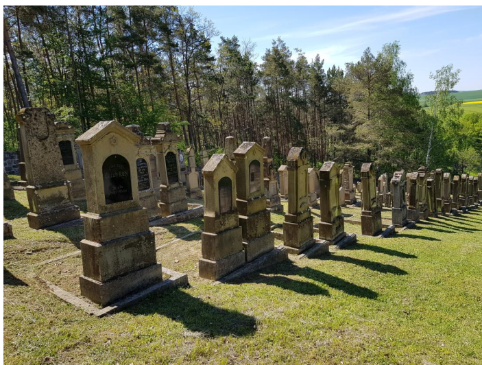
Jüdischer Friedhof Unsleben, 2021.

Der jüdische Friedhof liegt an einem Hügel ca. 1,5 km östlich von Unsleben. Er hat eine Fläche von über 2000 qm und wurde 1856 eingerichtet. Es sind noch etwa 240 Grabsteine erhalten. Die letzte Beisetzung erfolgte 1942.