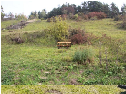
Jüdischer Friedhof Unsleben, 2021.

"Steinerne Zeugnisse jüdischen Lebens in Bayern" zur Verfügung gestellt. Dafür gilt ihm unser großer Dank. Diese Fotografien stellen gerade im Hinblick auf die in vielen Fällen in den letzten 25 Jahren sehr rasch fortgeschrittene Verwitterung der Grabsteine eine wertvolle Quelle dar.